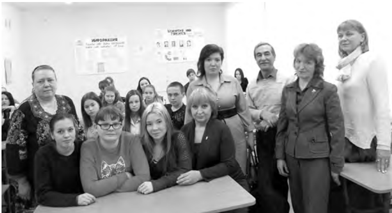
Члены литературного объединения в гостях у студентов Сарапульского индустриального техникума

Каждый месяц члены городского литературного объединения, работающего при газете «Красное Прикамье», собираются на свои заседания, чтобы пообщаться, обсудить новые произведения. А в промежутках между литобъединениями «выходят в люди»