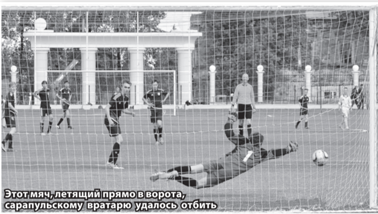
Этот мяч, летящий прямо в ворота, сарапульскому вратарю удалось отбить

состоялся в пятницу на стадионе «Энергия»