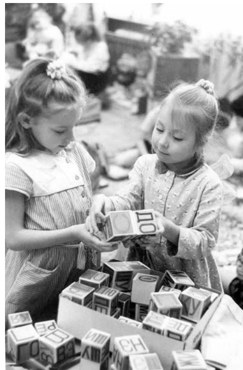
Подборку подготовила Ю. Надеждинская.

Я часто вспоминаю свое школьное детство, оно выпало на 1980-е. Особенно помню, как впервые отметили с друзьями окончание первого класса. Мы учились в школе № 15.