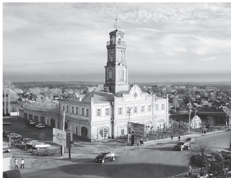
Сарапульская пожарная каланча

В 1817 году произошли изменения в народном образовании города: Сарапурльское малое на-