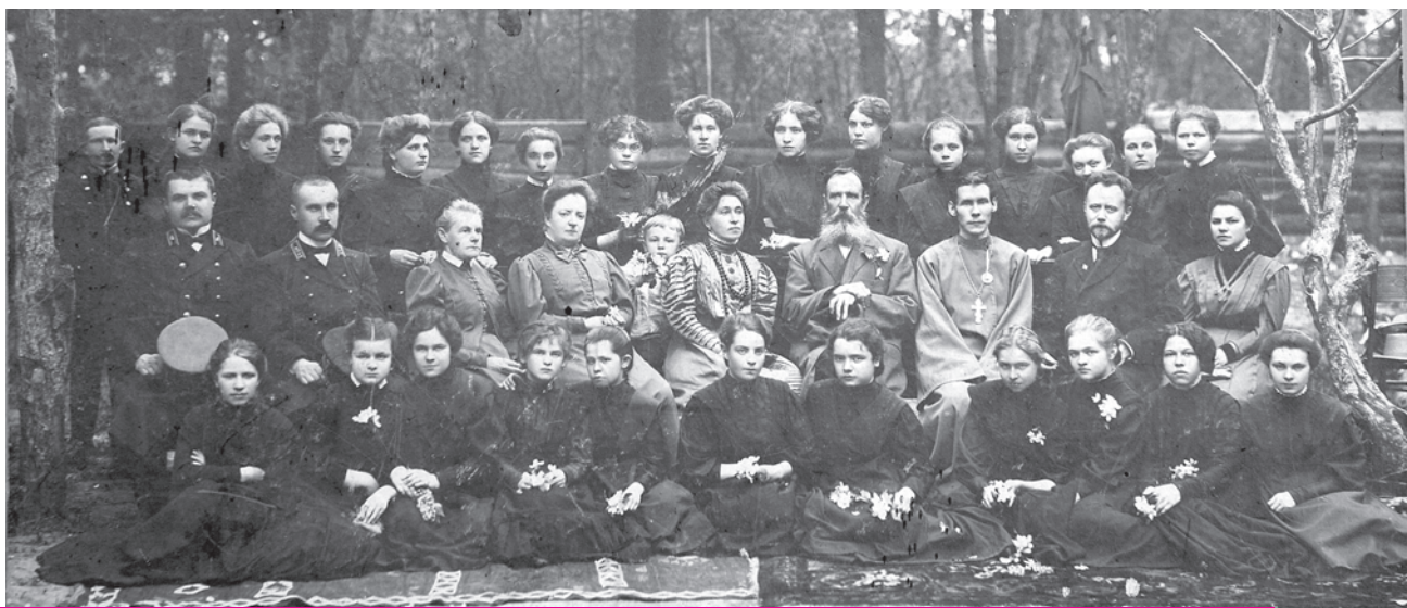
Выпускной класс Сарапульской женской гимназии, 1909 год