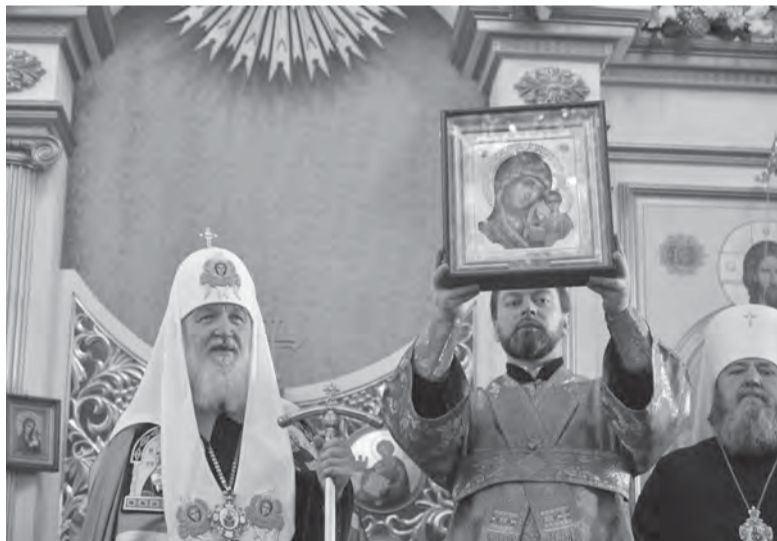
Икона Казанской Божией Матери - подарок Патриарха Покровскому храму

По завершении мероприятия в Покровском храме Святейший Патриарх Московский и всея Руси Кирилл посетил храм Святой Блаженной Ксении Петербургской и осмотрел Сарапульское Епархиальное управление, которое расположено на территории храма, и побывал на Даче Башенина, которая ему безмерно понравилась.