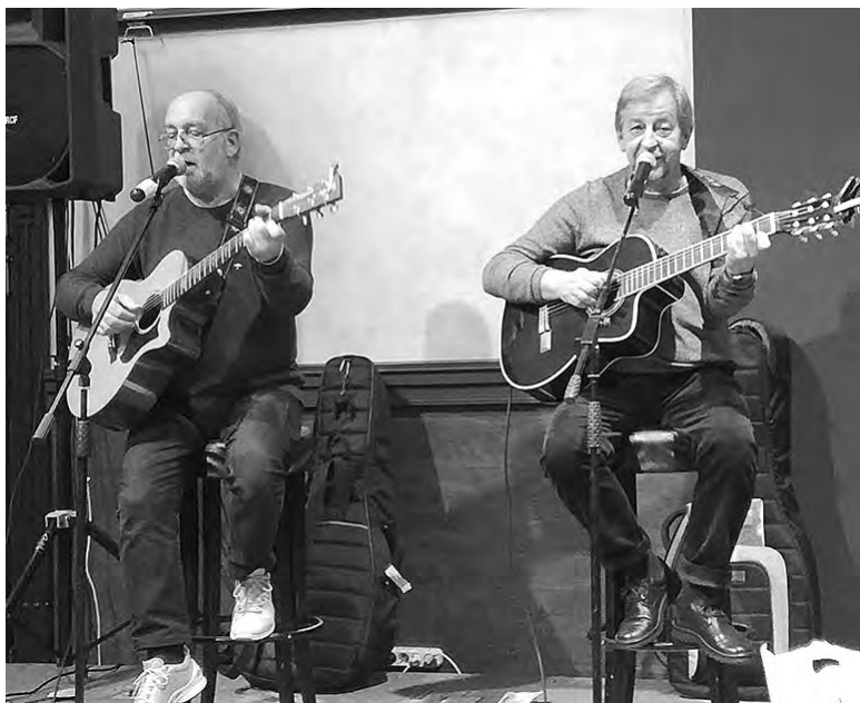
Выступают авторы-исполнители братья Мищуки

Подготовила Н. Глухова.