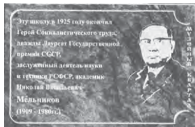
Мемориальная доска на здании школы № 15, г. Сарапул

для формирования активной жизненной позиции у молодого поколения. Популяризация научных знаний особенно важна в наше время. Президент России Владимир Путин сказал: «Важно воспитывать культуру исследовательской,