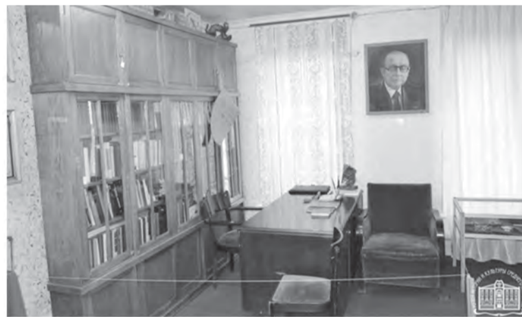
Экспозиция Мемориального дома-музея академика Н. В. Мельникова

В 2017 году Мемориальный дом-музей академика Н. В. Мельникова отмечает свой 30-летний юбилей. В рамках празднования данного события 28 апреля по инициативе Музея истории и культуры Среднего Прикамья состоялась региональная научно-практическая конференция «Мельниковские чтения-2017. Юные о Великих». В работе конференции приняли участие 35 воспитанников