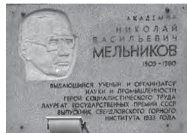
Мемориальная доска на здании Уральского государственного горного университета, г. Екатеринбург