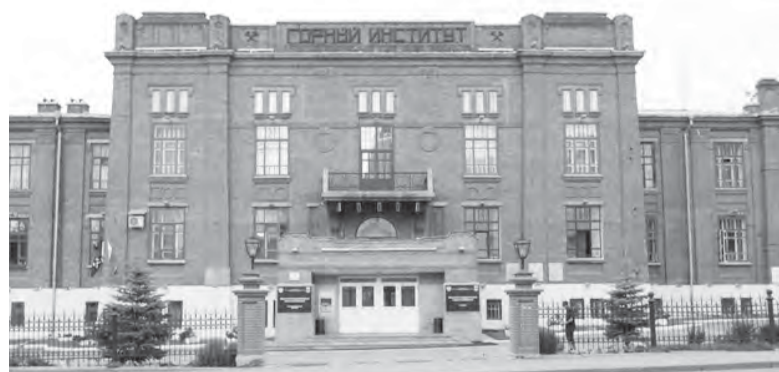
Уральский государственный горный университет, г. Екатеринбург

для формирования активной жизненной позиции у молодого поколения. Популяризация научных знаний особенно важна в наше время. Президент России Владимир Путин сказал: «Важно воспитывать культуру исследовательской,