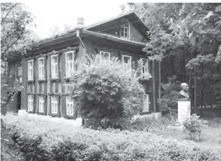
Мемориальный дом-музей академика Н. В. Мельникова

В нашем городе сохранился дом по ул. Азина, в котором в 1913–1928 годах жила