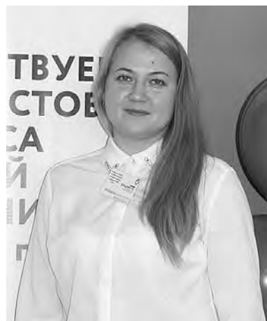
В конкурсе приняли участие восемь самых опытных и квалифицированных сотрудников

13 октября в с. Завьялово прошел конкурс «Лучший сотрудник МФЦ Удмуртской Республики»