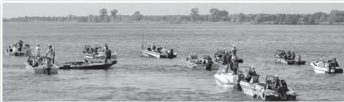
Экипажи на финише в ожидании взвешивания улова