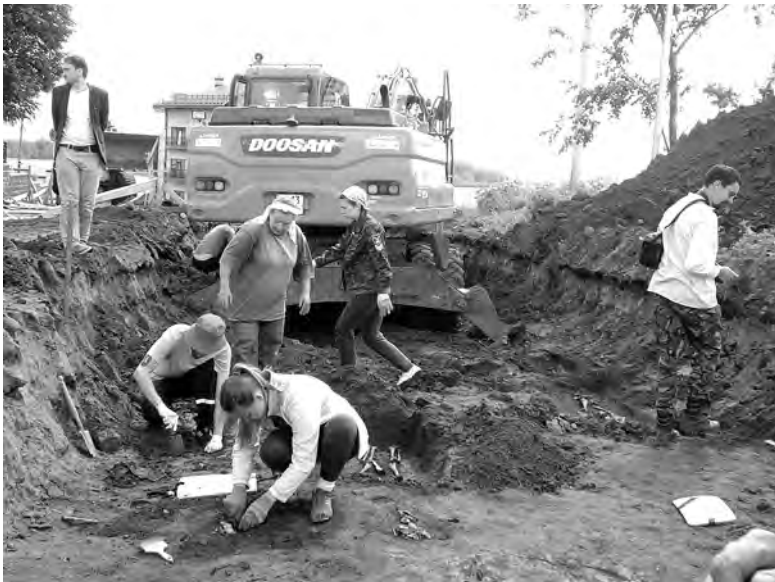
Раскапывать Сарапульский могильник помогают бульдозеристы

После того как в самом центре города сотрудниками Музея истории и культуры Среднего Прикамья и преподавателями кафедры истории Удмуртии, археологии и этнологии Удмуртского государственного университета был обнаружен могильник XVII-XVIII веков, жители Сарапула пожелали сделать археологию своим хобби