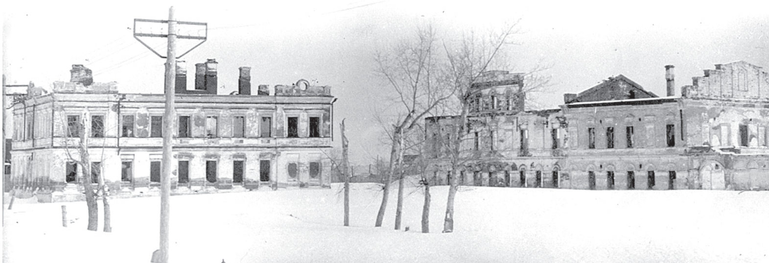
Разрушенные здания на Соборной площади во время «винных погромов» в ноябре 1917 года

Владимир Азин беспрестанно придерживался принципа: успех в войне на три четверти зависит от духа войск и на одну четвертую - от реальных