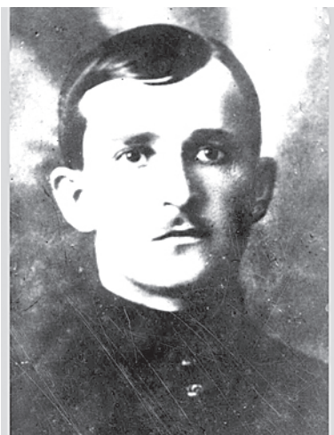
В. М. Азин

Красный комдив. Яркий, молодой военачальник.