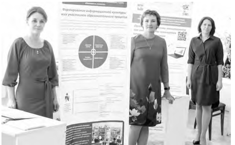
На презентации инновационных проектов

18 выступлений на секциях и четыре мастер-класса было заявлено в Программе Ярмарки от образовательных учреждений Сарапульского района.