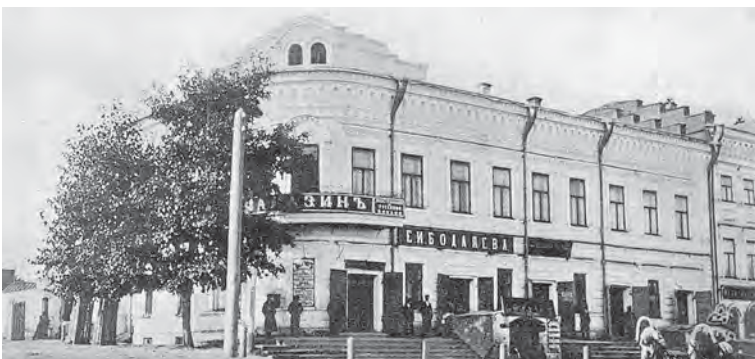
Магазин на ул. Вятской