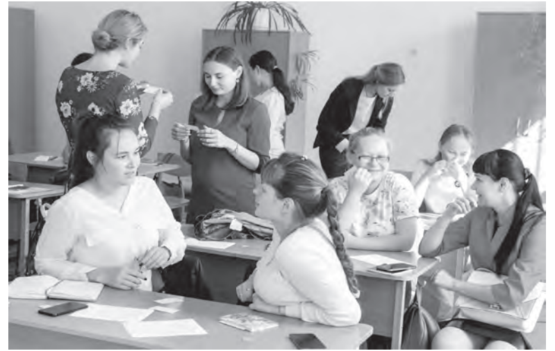
На форуме «Новая волна» в школе № 15 состоялась встреча молодых педагогов

С 2019 года в 9-х классах планируется проведение итогового собеседования по русскому языку как допуска к ГИА.