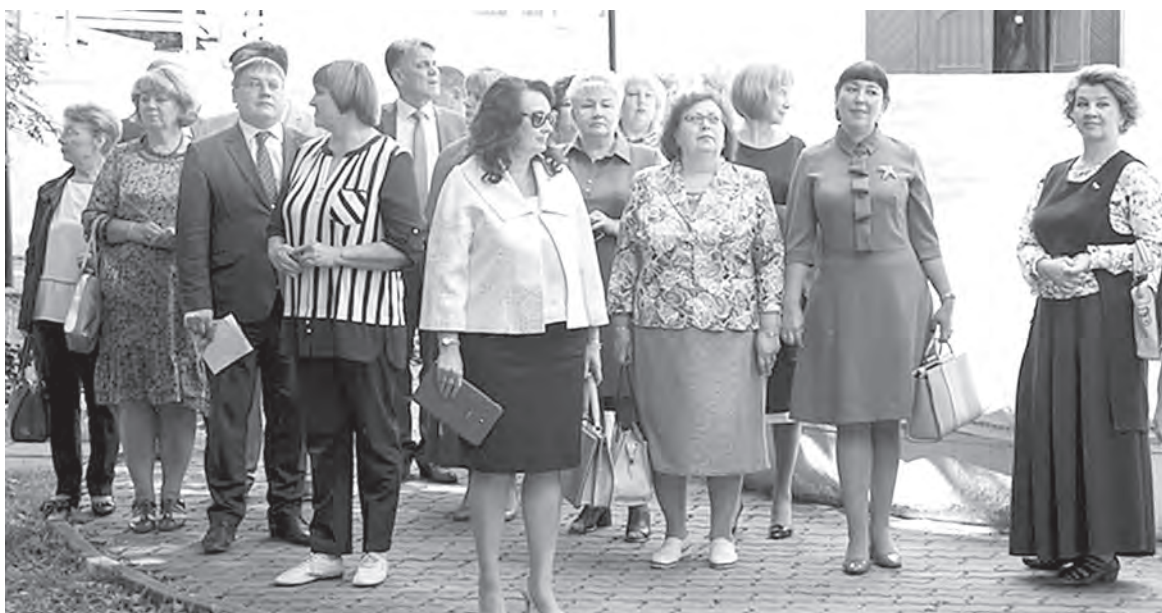
В рамках музейного экскурсионного тура «В городе рыжей девочки» руководители образовательных организаций города побывали на Даче Башенина