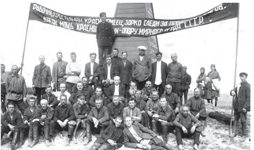
Участники революционных событий в г. Сарапуле у памятника 62 красноармейцам роты Пензенского полка 28 дивизии, расстрелянным 11 апреля 1919 года