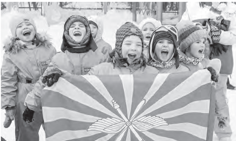
Отряд «Летчики» детского сада № 46

Пройти непростые испытания и найти спрятанные знамена отрядов – такова была главная задача для воспитанников детских садов №№ 19, 30, 33, 34, 41 и 46 – участников игры «Зарница», состоявшейся в минувший понедельник на территории 46-го детсада