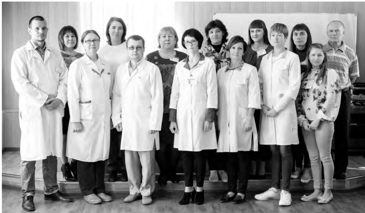
Коллектив Сарапульской станции по борьбе с болезнями животных

В пятый раз в России отмечается ежегодный праздник - День работников ветеринарной службы, официально утвержденный в 2014 году