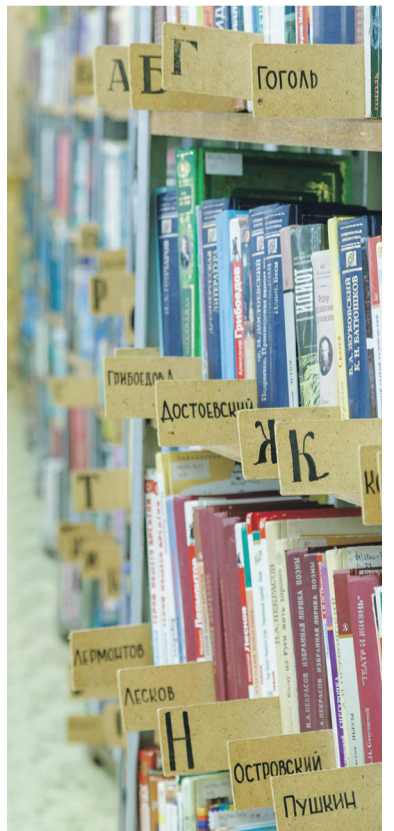
Вечно живая классика