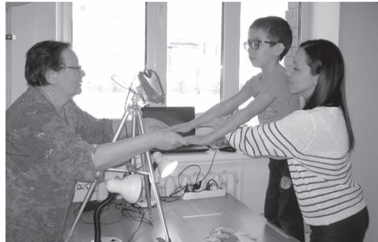
Работа над очередным мультфильмом

В онлайн режиме прошла межрегиональная конференция для педагогов дополнительного образования, в которой приняли участие педагогические работники Центра «Потенциал»