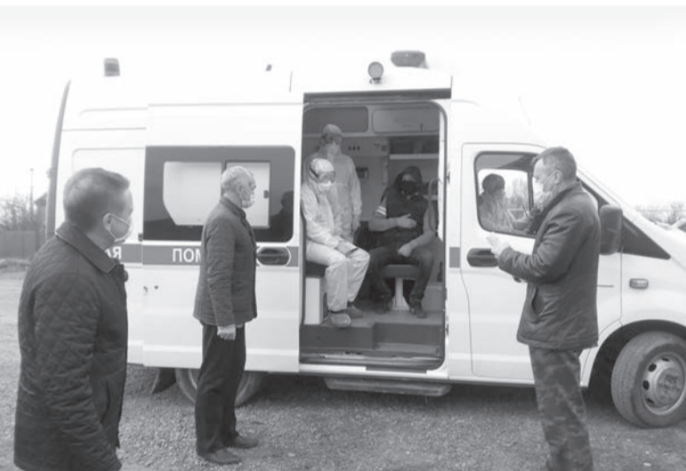
Учебные мероприятия по работе с условным больным

Медицинские работники района решают актуальные вопросы по профилактике распространения COVID-19