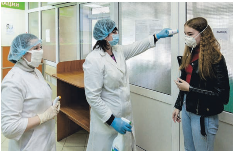
Обязательные процедуры для каждого пациента - измерение температуры и обработка рук

Пандемия коронавируса внесла коррективы и в работу Сарапульской городской детской больницы