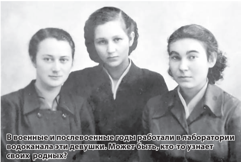
В военные и послевоенные годы работали в лаборатории водоканала эти девушки. Может быть, кто-то узнает своих родных?