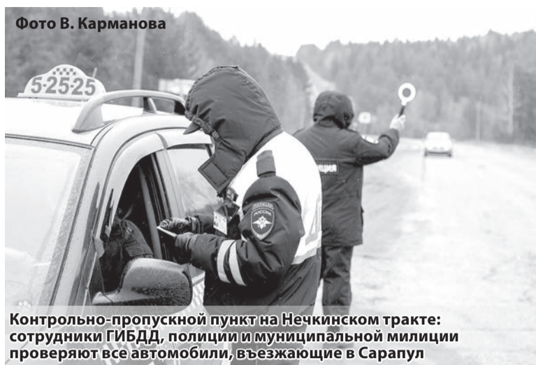
Контрольно-пропускной пункт на Нечкинском тракте: сотрудники ГИБДД, полиции и муниципальной милиции проверяют все автомобили, въезжающие в Сарапул

На данный момент на всех железнодорожных станциях в республике и в Ижевском аэропорту идет жесткий контроль за въезжающими в Удмуртию из Москвы, Московской области и Санкт-Петербурга, где на