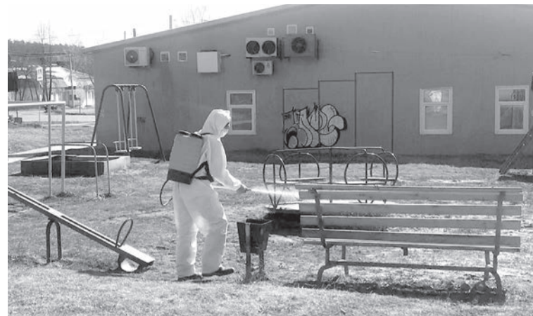
Обработка детской площадки в с. Северный

С 6 апреля в Сарапульском районе проводятся работы по дезинфекции мест общего пользования. Обрабатываются остановочные комплексы, входные группы и подъезды многоквартирных домов, детские площадки.