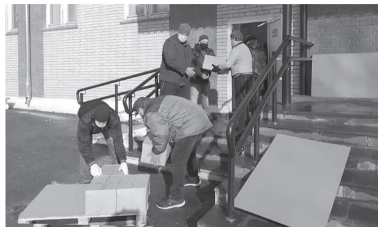
Доставка продуктовых наборов в школу

Продуктовые наборы для детей поступили в Сарапульский район