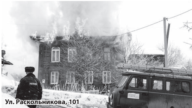
Ул. Раскольников, 101

Беседовала М. Розова.