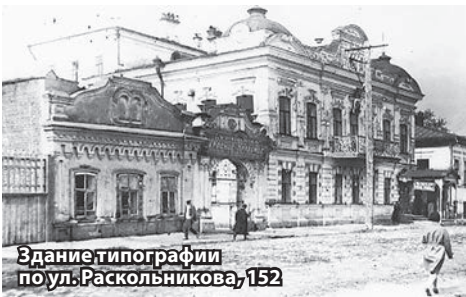
Здание типографии поул. Раскольникова, 152

● 160 лет назад, в 1861 году, была построена Свято-Троицкая церковь на средства городского общества и благотворителей.