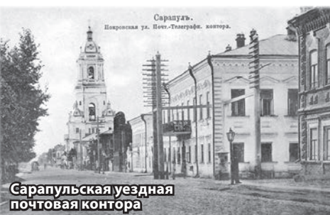
Сарапурльская уездная почтовая контора

● 210 лет назад, в 1811 году, была открыта Сарапурльская городская больница на 15 коек, подведомственная Приказу общественного призрения.