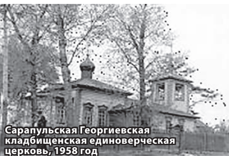
Сарапурльская Георгиевская кладбищенская единоверческая церковь, 1958 год

● 180 лет назад, в 1841 году, в Сарапуре был учрежден Цех трубочистов «...из людей, занимающихся каменной, печною и штукатурною работами, с возложением на них обязанностей, предписанных ремесленным положением и уставом пожарным в отношении осмотра печей и чистения труб, предоставив мастерам получать с домохозяев за работу плату по взаимному согласию...»