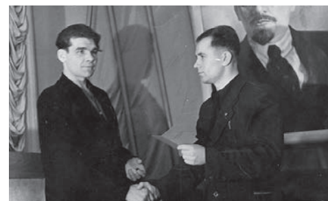
1-й секретарь Сарапурльского горкома ВЛКСМ вручает рабочему комсомольскую путевку на освоение целинных и залежных земель, 1955 год

● 80 лет назад, в 1941 году, в Сарапуре прибыли работники и оборудование эвакуированного из Баку завода глубоких насосов и долот им. Дзержинского.