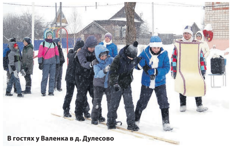
В гостях у Валенка в д. Дулесово