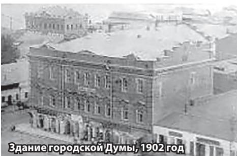
Здание городской Думы, 1902 год

● 155 лет назад, в 1866 году, на Соборной площади было построено здание городской Думы.