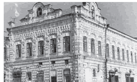
Кинотеатр «Гигант» на 470 мест, позднее переименованный в кинотеатр «Восток»

● 95 лет назад, в 1926 году, был открыт кинотеатр «Гигант» на 470 мест (позднее переименованный в кинотеатр «Восток»). До 1939 года он считался