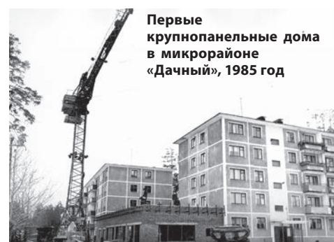
Первые крупнопанельные дома в микрорайоне «Дачный», 1985 год

● 65 лет назад, в 1956 году, сарапурльский отряд комсомольцев и молодежи, принимавший участие в уборке урожая в Акмолинской (Целиноградской) области Казахской ССР, был награжден Почетной грамотой Акмолинского обкома комсомола.