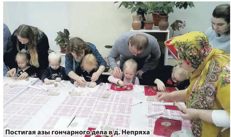
Постигая азы гончарного дела в д. Непряха