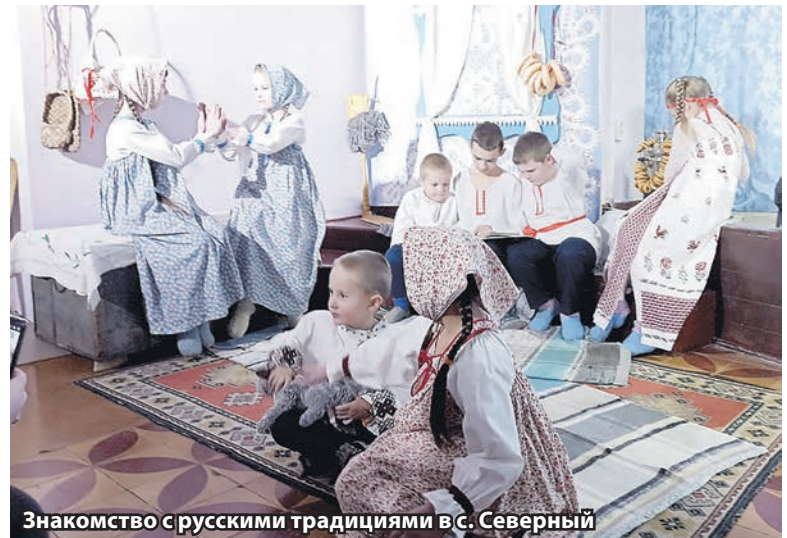
Знакомство с русскими традициями в с. Северный