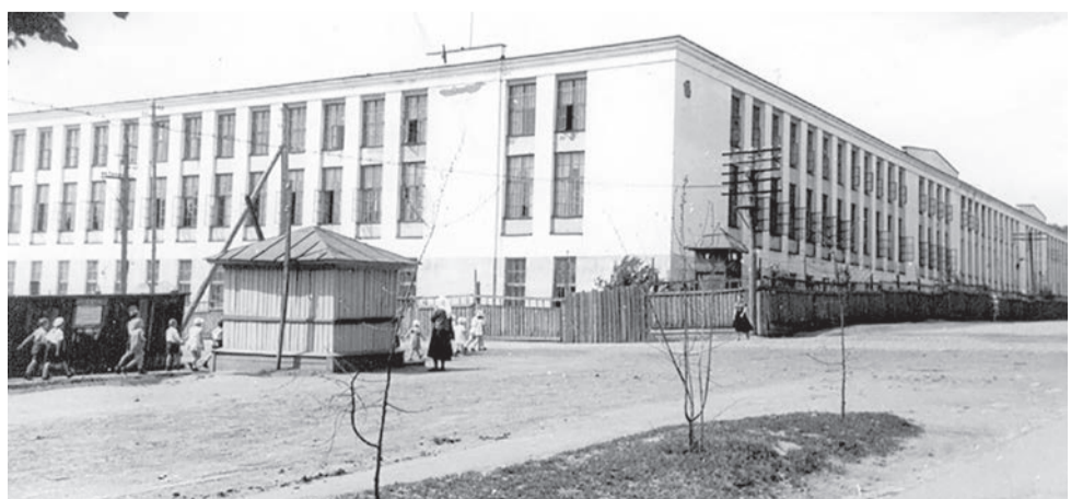
Корпус № 1 на углу улиц Первомайской и Гоголя, 1959 год