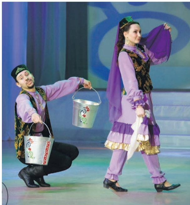
■ Фестиваль «Радуга дружбы»