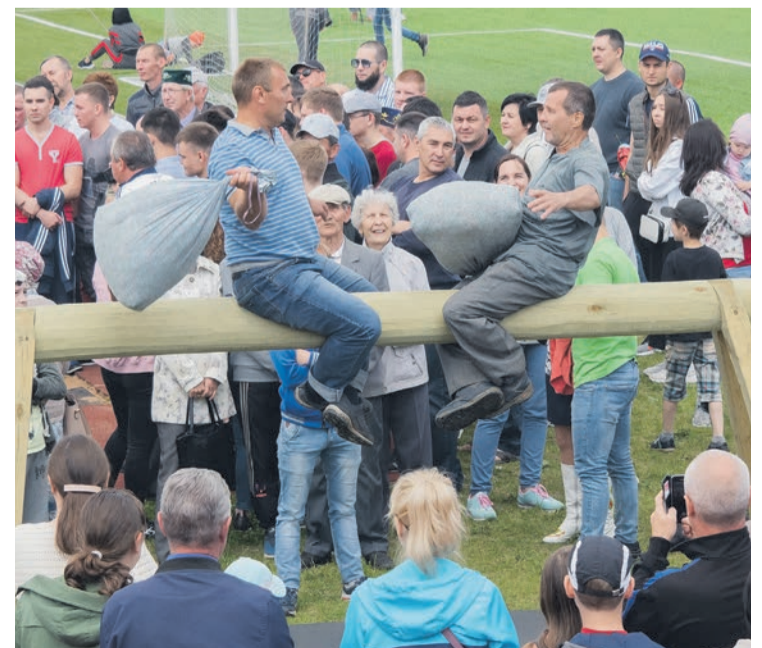
■ Веселый Сабантуй любят жители Сарапула всех национальностей