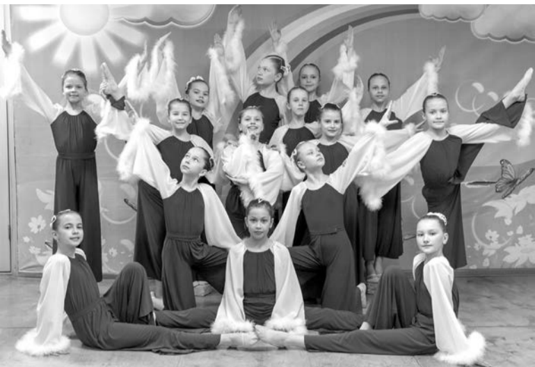
Группа «Лялечки» завоевала «Гран-при» фестиваля «Star FRIENDS» в Ижевске

Коллектив «Линия танца» Детского парка – активный участник конкурсного движения