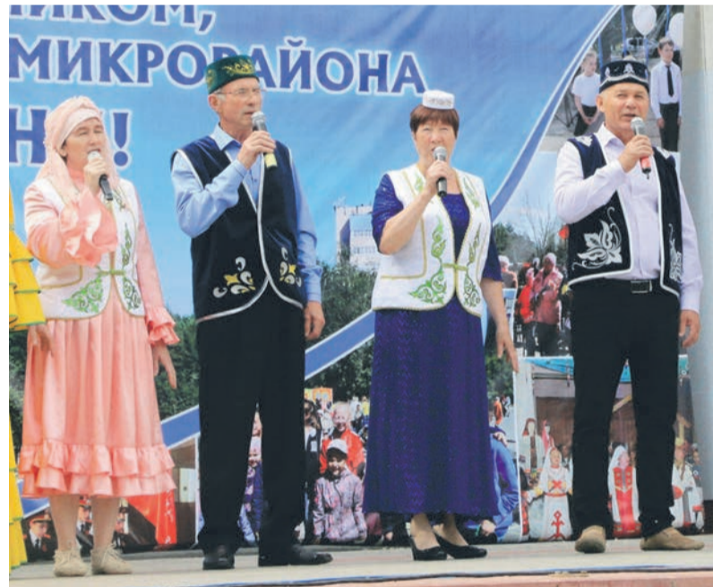
■ Выступление в День Победы