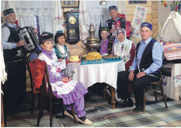
■ В национальном музее Центра татарской культуры

В 1991 году в Сарапуле появился Татарский общественный центр