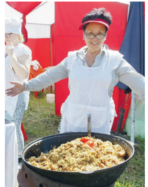
■ Гостеприимство по-татарски