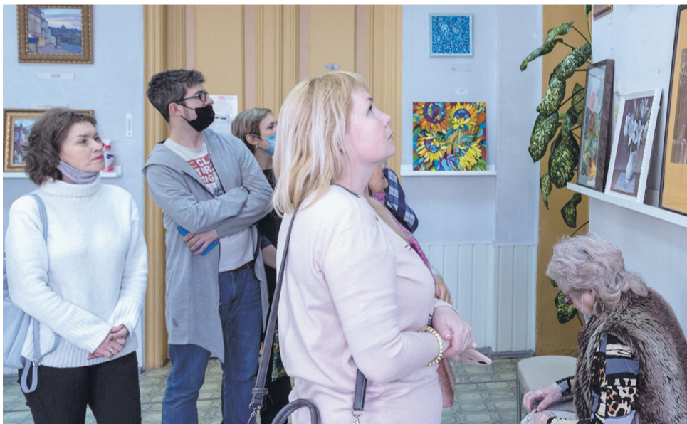
Посетители с интересом рассматривают полотна сарапульских мастеров