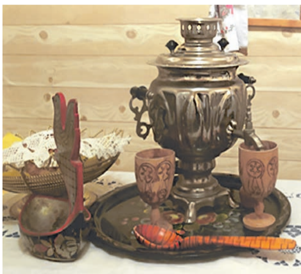
■ Музейная комната детсада № 5