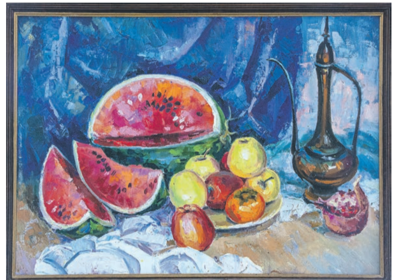
Н. Ващук «Арбуз». Холст, масло. 1999 г.