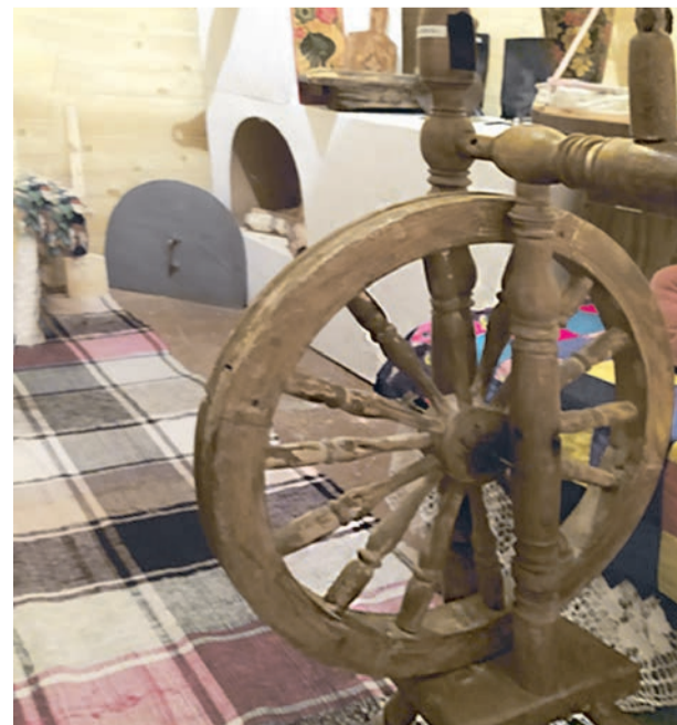
■ Музейная комната детсада № 5