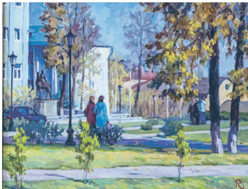
В. Конохова «Осенняя прогулка». 2020 г.