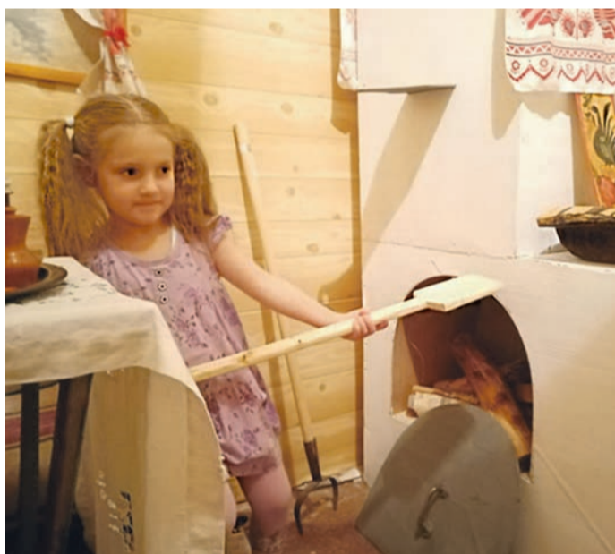
■ В музейной комнате детского сада № 5