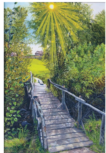
Г. Графов «Старый мостик». Холст, масло. 2015 г.