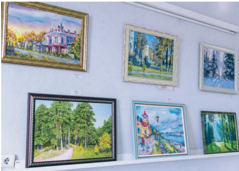
Часть экспонатов весенней выставки живописи