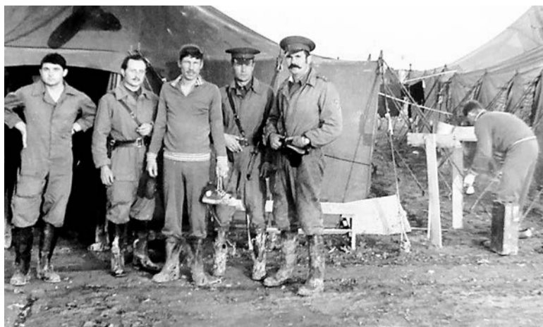
Вот в таких условиях мы начинали новую страницу нашей истории в Афганистане