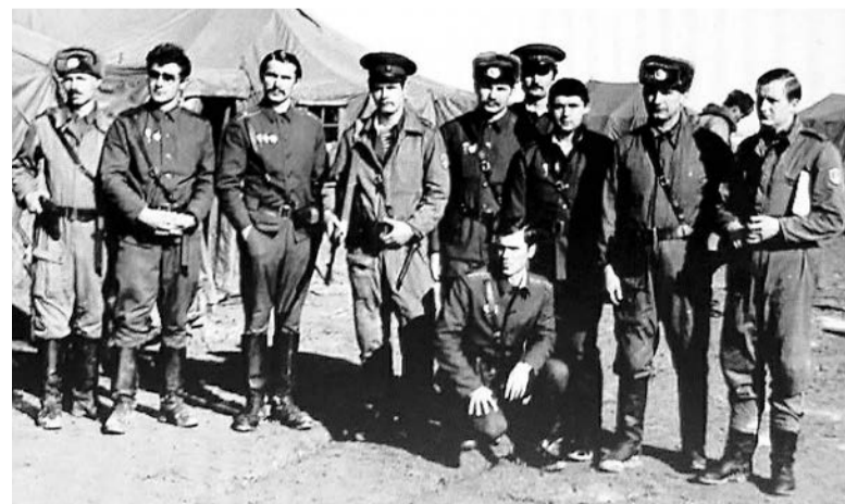
Личный состав медбата. 1979-1981 годы