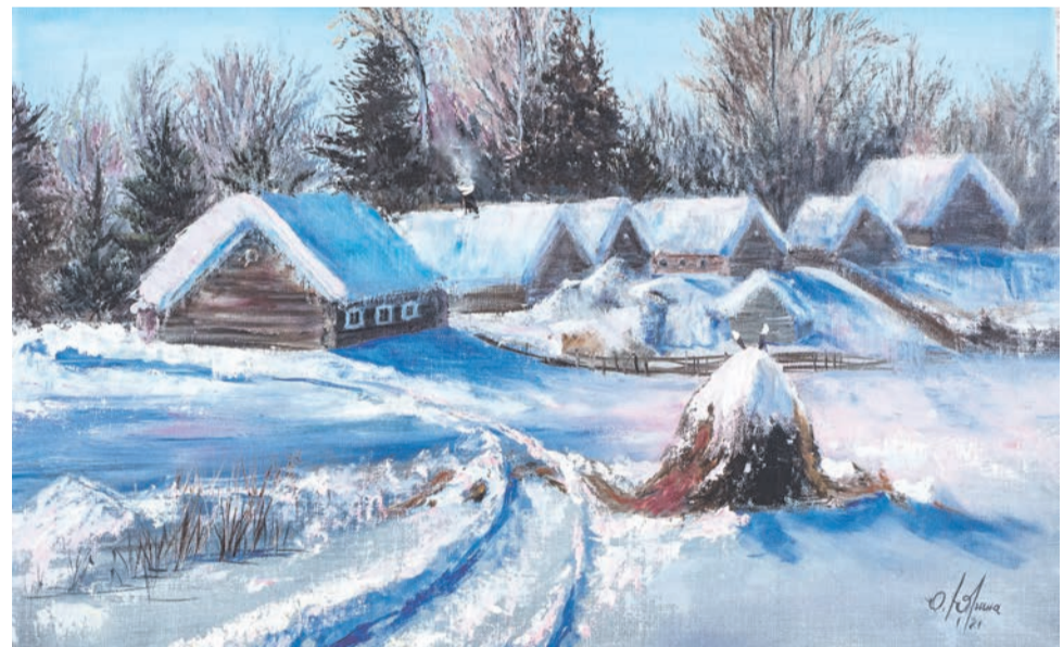
О. Юрина «Простор». Холст, масло. 2017 г.