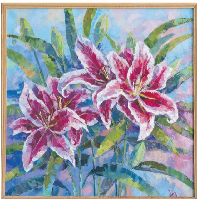
О. Ильина «Лилии». Холст, масло. 2020 г.