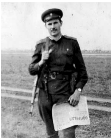
Чехословакия. 1968 год