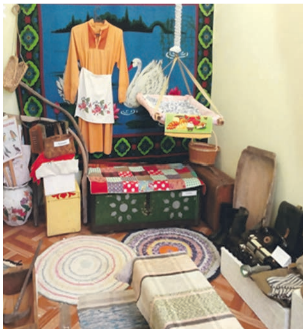
■ Музейная комната в детском саду № 43