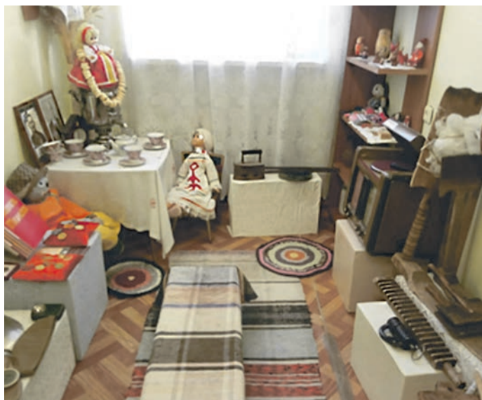
■ Музейная комната в детском саду № 43