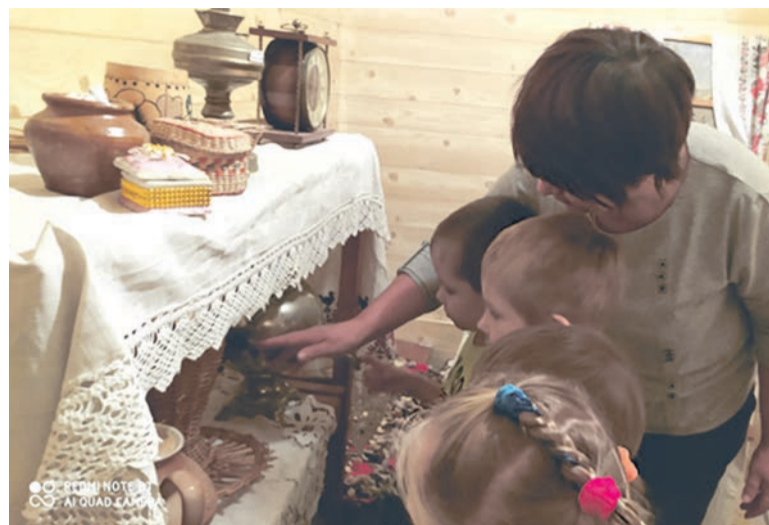
■ В музейной комнате детского сада № 5

Материал подготовлен коллективами детских садов.