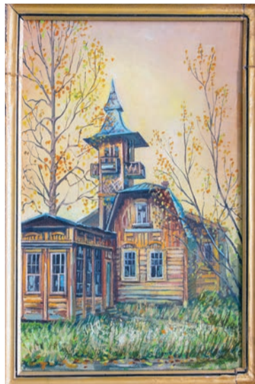
Ю. Максимов «Старый Сарапул». Холст, масло. 2010 г.