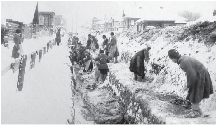
Жители города на общественных работах: рытье каналов для прокладки водопровода. 1902 год

«На основании исторических данных постановляю: считать датой образования предприятия «Благоустройство» март 1796 года».