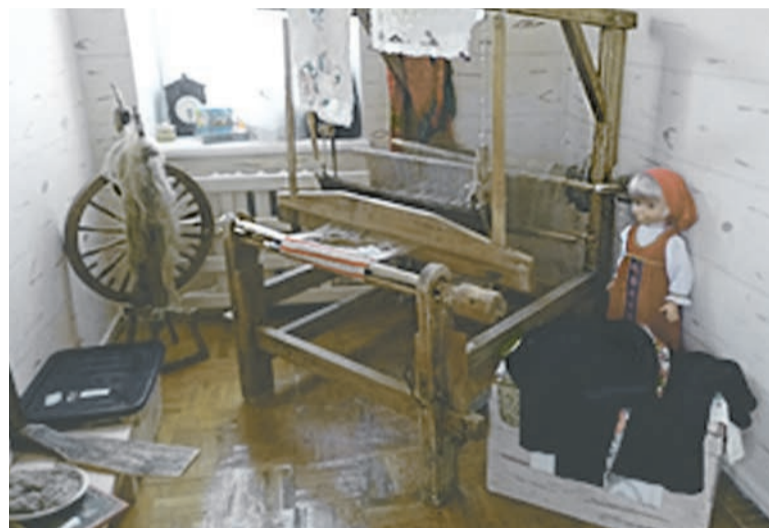
■ Музейная комната в детском саду № 46