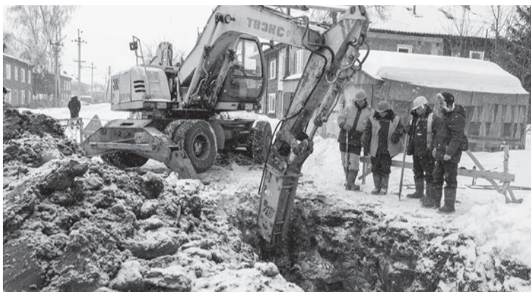
Ведутся ремонтные работы по ул. Рабочей, 6

На предприятии активно идет подготовка к плановым летним работам. Климатологи предсказывают, что подобные сильные кратковременные