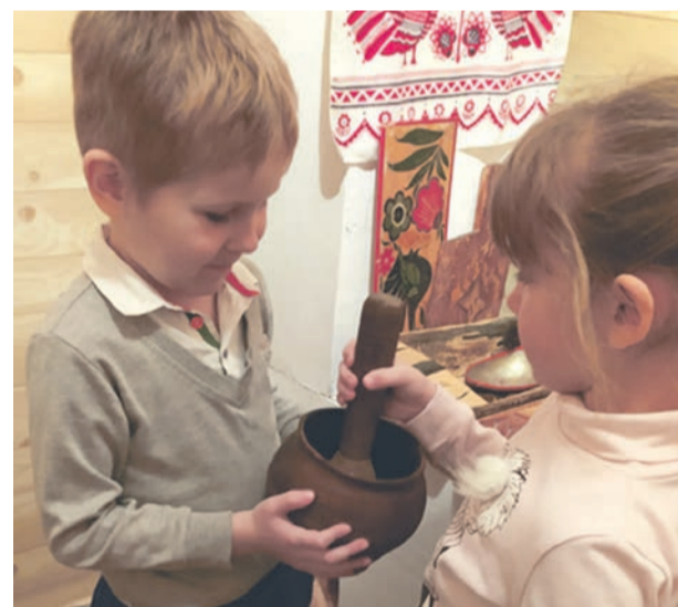
■ Музейная комната детсада № 5