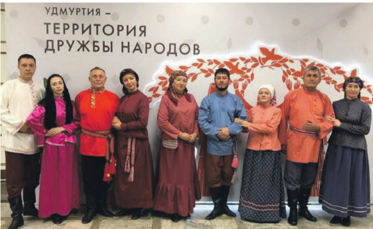
Сотрудники районного культурного центра «Спектр», Мостовинского культурного центра и Выездинского клуба