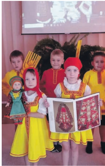
Воспитанники детского сада № 17