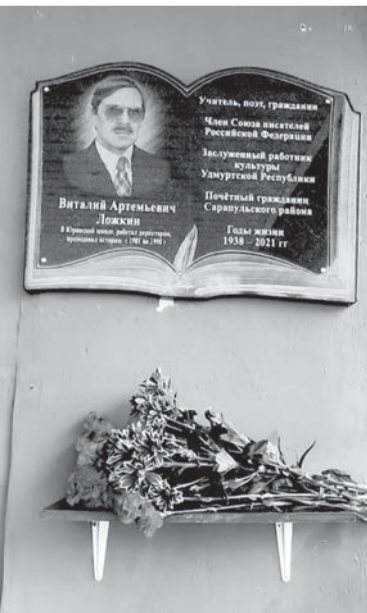
Мемориальная доска на здании Юринской школы, посвященная Виталию Ложкину