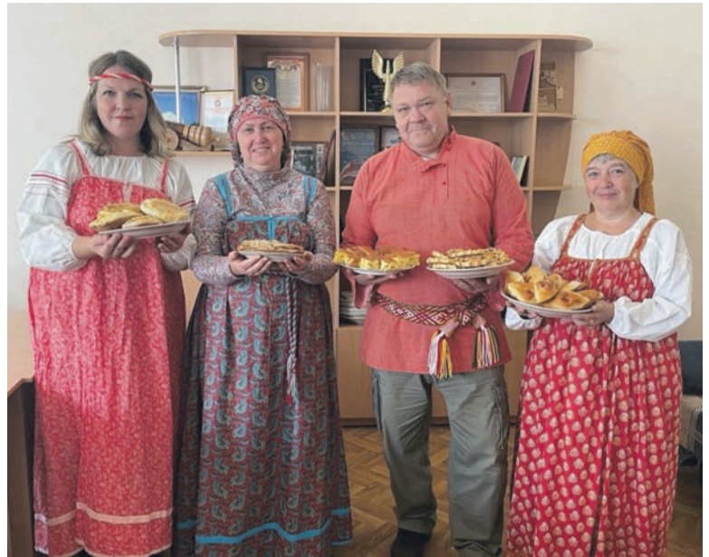
Сотрудники редакции газеты «Красное Прикамье»