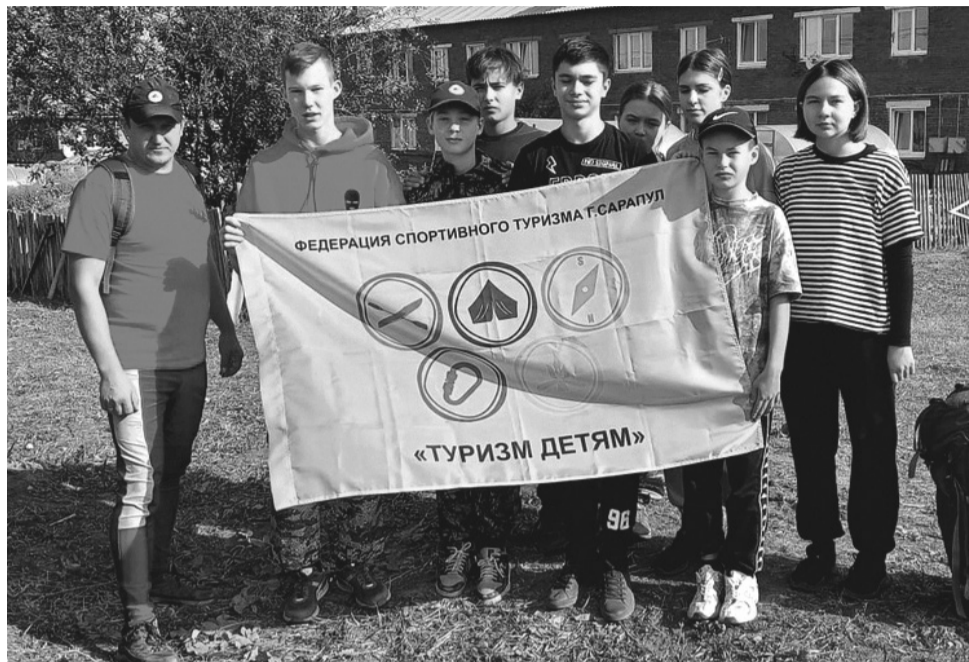
Команда школы № 25