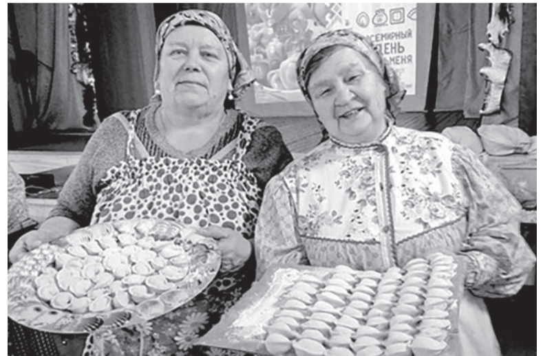
Пельмени - всем на загляденье