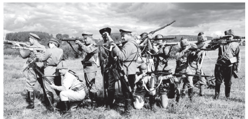
Военно-историческая реконструкция боя времен гражданской войны