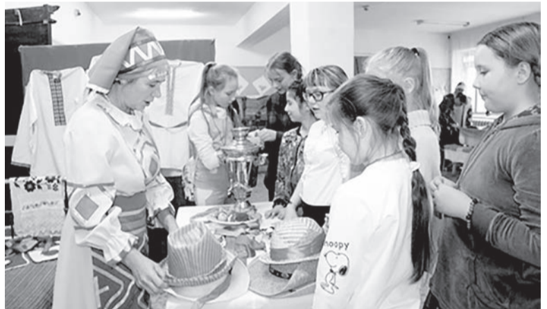
В сувенирной лавке