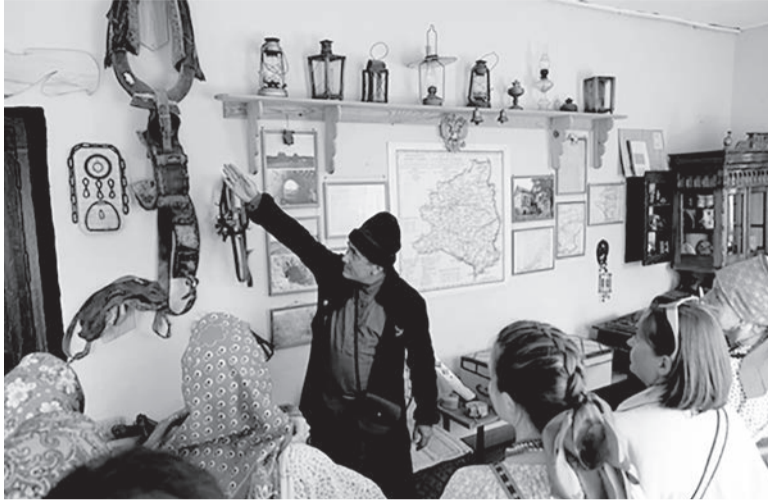
Предметы, канувшие в Лету

экскурсии вас познакомят с устройством почтовой станции, ее бытом и предметами канувшей в Лету старины.