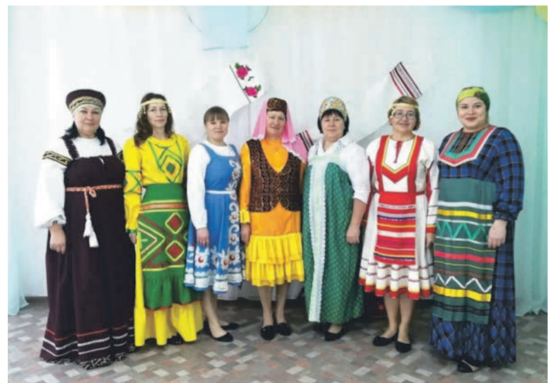
Жители деревни Дулесово