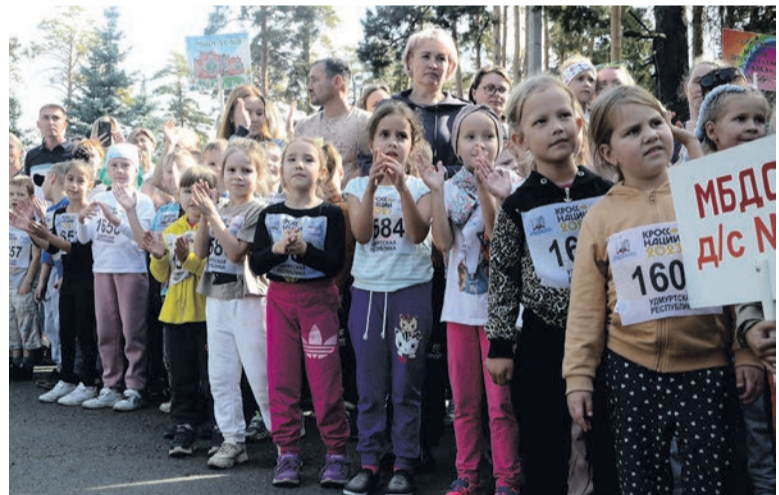
Команды дошкольных учреждений г. Сарапула