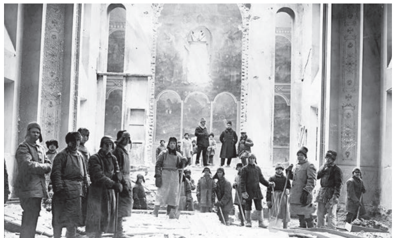
Разрушение Никольской церкви

Экскурсии будут проводиться в субботу и воскресенье в 13.00, 14.00, 15.00 и 16.00, запись по тел. 8-903-230-81-76 ; с понедельника по пятницу - по предварительной записи по тел. 8-912-855-20-41 . Вход свободный.