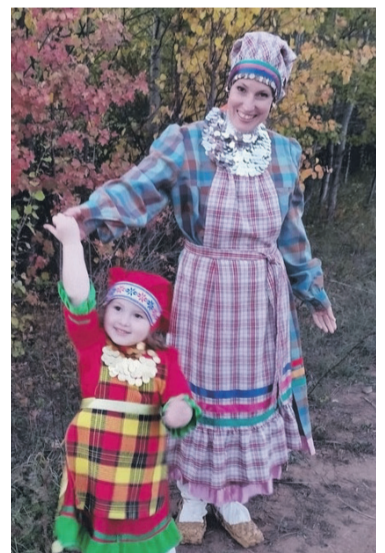
Семья Асатовых, детский сад № 41