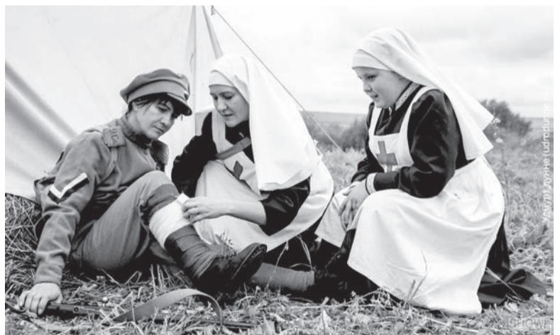
Раненому солдату помогают сестры милосердия