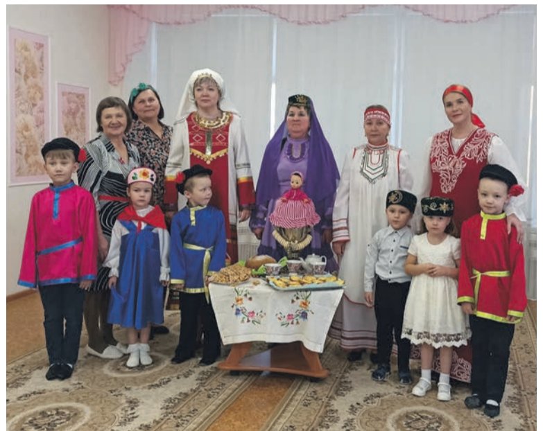
Воспитанники и сотрудники детского сада № 43