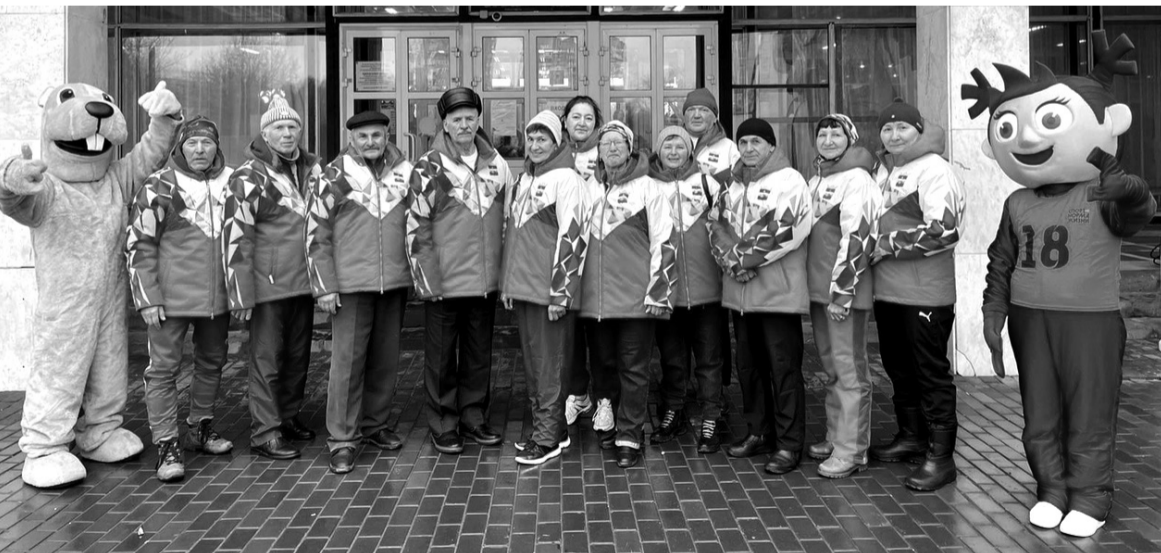
Команда Сарапульского района на VIII Зимней Спартакиаде пенсионеров Удмуртии

В Сарапульском районе прошла Районная зимняя Спартакиада ветеранов