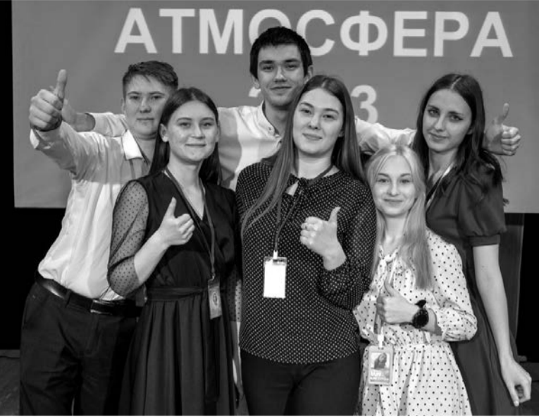
Авторы проекта республиканского конкурса «Атмосфера»

Шесть идей, предложенных студентами и школьниками Сарапульского района, будут воплощены в жизнь в этом году