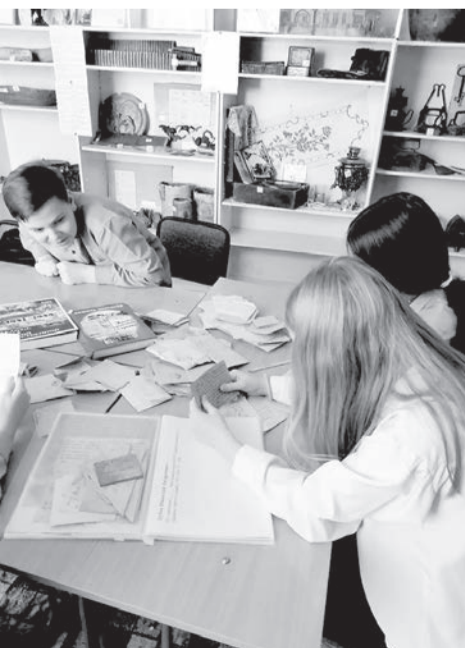
Юные краеведы школы № 23 за работой

Прочитав письма, мы стали проводить исследовательскую работу по изучению биографии участника