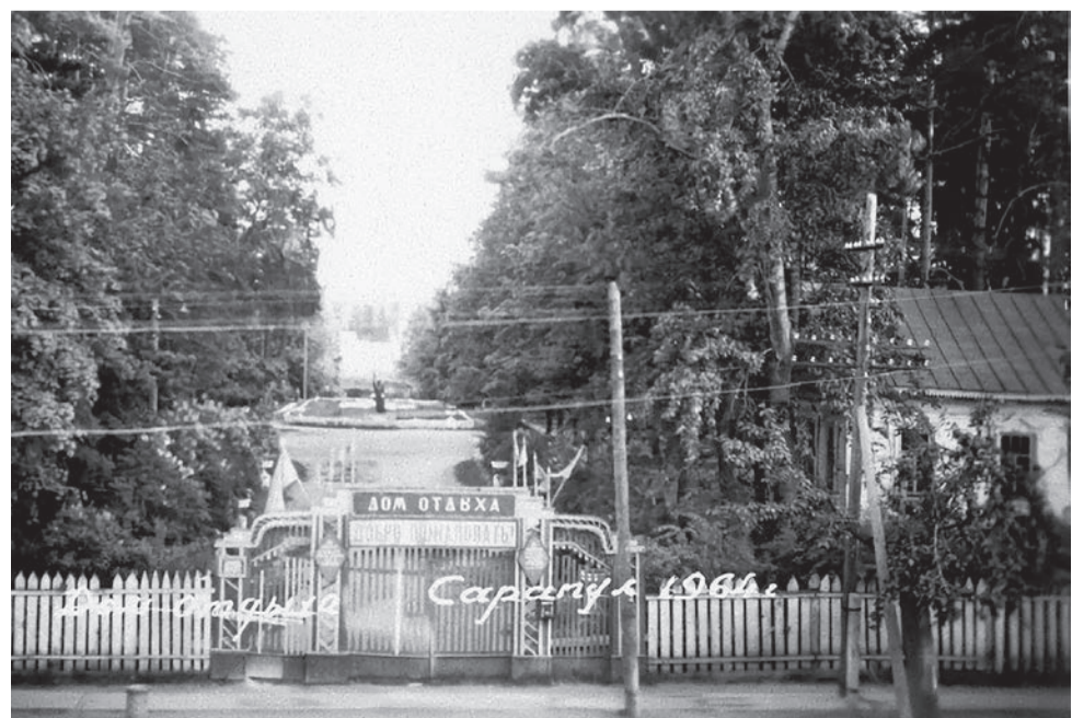
Дом отдыха «Учитель», 1964 год