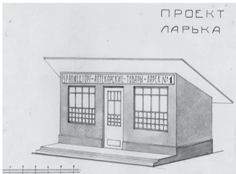
Проект киоска санитарии и гигиены, 1929 год (Ф. Р-297. Оп. 1. Д. 53. Л. 14)

95 лет назад, 1 октября 1929 года, в Сарапуле был открыт киоск санитарии и гигиены АО «Уралмедторг» для улучшения снабжения населения медикаментами и развертывания пропаганды по сбору дикорастущих лекарственных растений. Располагался он на углу улиц Красного Спорта (совр. - Гагарина) и Красноармейской. На фасаде здания размещался баннер: «Здесь справочное бюро по вопросам здравоохранения».