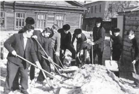
Учащиеся Сарапульского пищевого техникума на коммунистическом субботнике, 1961 год (Ф. Р-750. Оп. 1Ф. Д. 286)

105 лет назад, 13 сентября 1919 года, в Сарапуле был проведен первый коммунистический субботник.