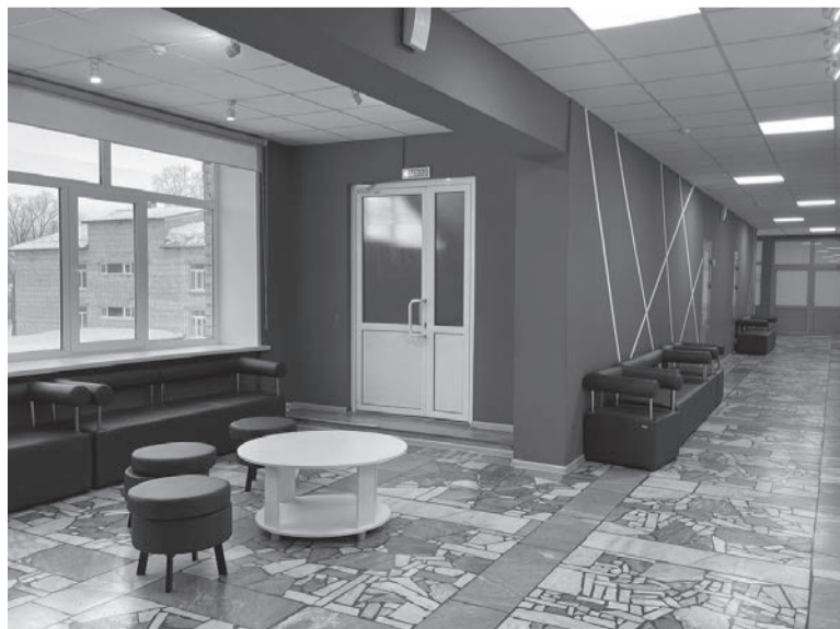
Зона отдыха: уютно и современно