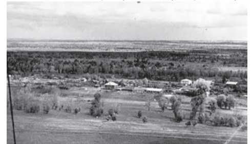
Рабочий поселок Симони́ха. Вид со Старцевой горы города Сарапула, 1970 год (Ф. Р-750. Оп. 1Ф. Д. 15794)

75 лет назад, 22 ноября 1949 года, населенный пункт Симони́ха был отнесен к категории рабочих поселков, поссовет р.п. Симони́ха был передан в подчинение Сарапульскому горсовету.