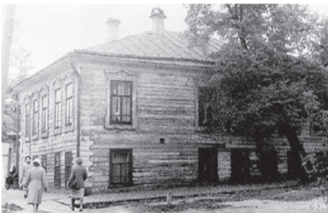
Жилой дом на углу улиц Красной (ныне - Раскольниковой) и Первомайской. С ноября 1919 года по январь 1921 года в этом здании размещался комиссариат по организации Удмуртской автономной области, 1955 год (Ф. Р-750. Оп. 1Ф. Д. 11193)