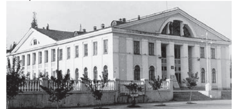
Здание Дома культуры «Заря» в микрорайоне «Южный», 1955 год (Ф. Р-750. Оп. 1Ф. Д. 11204)

70 лет назад, 5 ноября 1954 года, в Сарапуле открылся Дом культуры «Заря».