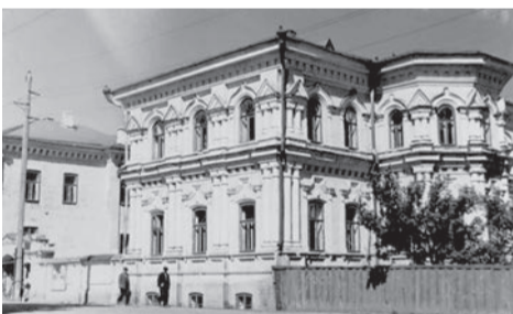
Здание Сарапульской средней школы № 18 по улице Азина, 1957 год (Ф. Р-750. Оп. 3Ф. Д. 2. Л. 23)

105 лет назад, в октябре 1919 года, была образована советская трудовая школа 1-й ступени № 18 (ныне - лицей № 18).