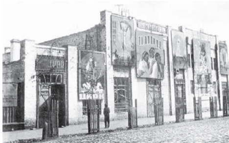
Здание Сарапульского кинотеатра «Отдых», 1936 год (Ф. Р-750. Оп. 1Ф. Д. 11994)

90 лет назад, 15 сентября 1934 года, кинотеатр «Отдых» был оборудован для показа звуковых фильмов.