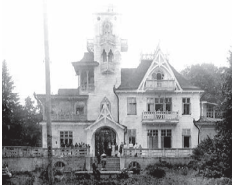
Здание детского туберкулезного санатория № 1, бывшей дачи купца П.А. Башенина, 1940 год (Ф. Р-750. Оп. 1Ф. Д. 12684)

ческое учреждение, специализирующееся на оздоровлении детей (ныне - Сарапульский районный санаторий для детей «Рябинушка» Минздрава УР).