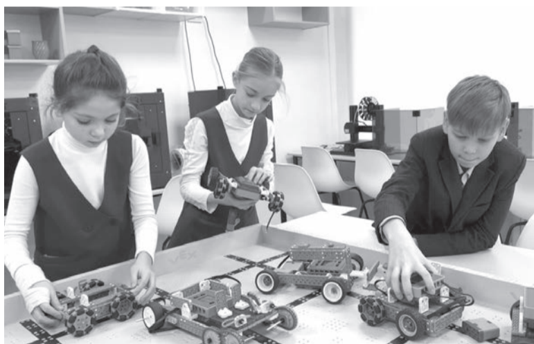
Робототехника - дело увлекательное

Во всех кабинетах проведен современный ремонт, закуплена новая мебель, учебное оборудование отвечает современным требованиям преподавания учебных предметов естественнонаучного цикла. Общий бюджет проекта составил более 26 млн рублей - это средства федерального и городского бюджетов, привлеченные внебюджетные средства.