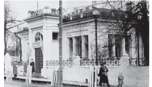
Здание Сарапульской санитарно-эпидемиологической станции, 1958 год (Ф. Р-750. Оп. 3Ф. Д. 118. Л. 27)

85 лет назад, 1 ноября 1939 года, была организована Сарапульская межрайонная санитарно-эпидемиологическая станция с обслуживанием Сарапульского, Камбарского, Киясовского и Каракулинского районов. 24 ноября 1944 года была реорганизована в Сарапульскую городскую санэпидстанцию с обслуживанием Сарапульского района. Ныне - филиал ФБУЗ «Центр гигиены и эпидемиологии в Удмуртской Республике» в городе Сарапуле.