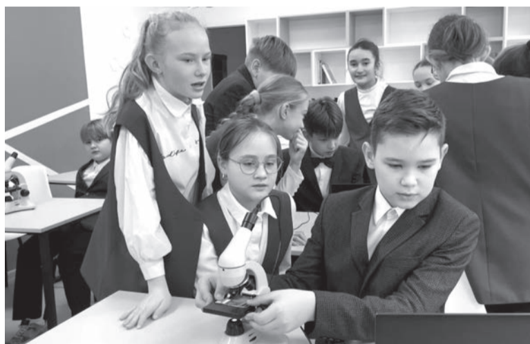
Биология - это интересно