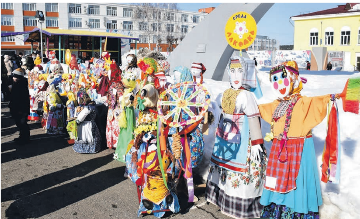
Вот таких масленичных кукол изготовили жители микрорайона «Южный»