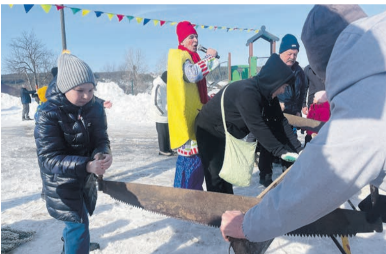
Конкурс по распиливанию бревна на праздновании Масленицы на площади многофункционального культурного центра в микрорайоне «Дубровка»