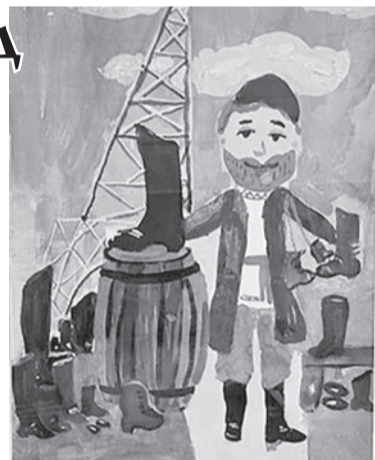
Рисунок ученицы 1 класса ДШИ № 1 Марии Чикуровой «Сарапульский купец на Всемирной выставке в Париже»