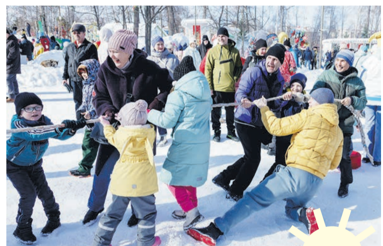
Веселые игры объединили горожан