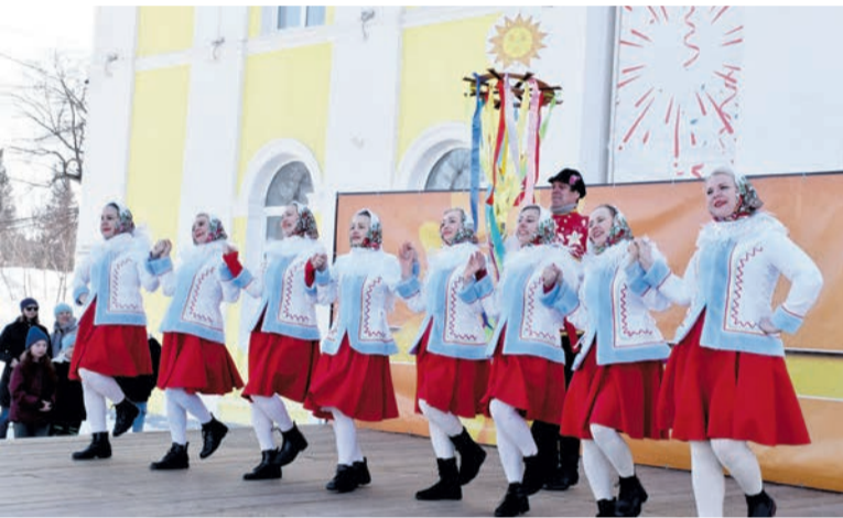
Коллектив народного танца «Забава»