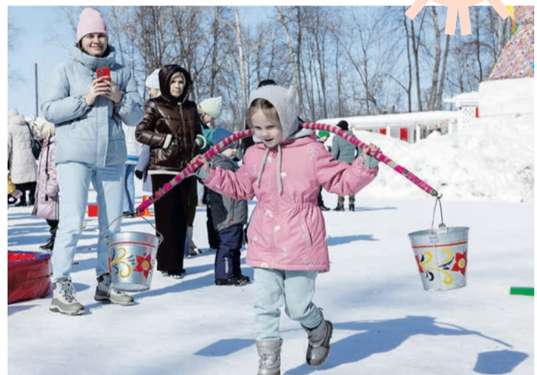
В городском саду им. А.С. Пушкина