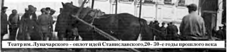
Театр им. Луначарского - оплот идей Станиславского, 20-30-е годы прошлого века

СЕМНАДЦАТОГО января – в день 150-летия со дня рождения известнейшего режиссера и создателя теории сценического искусства, метода актерской техники – в Сарапульском драматическом театре открылась выставка «Станиславский в Сарапуле».