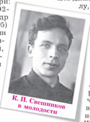
К. П. Свешников в молодости