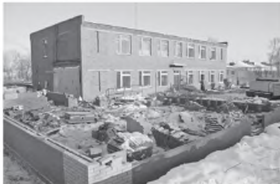
Реконструкция детсада в с. Кигбаево

Следующим объектом для посещения стал строящийся в Кигбаево детский сад. Строительство этого дошкольного учреждения также было одним из наказов сельчан своему депутату. Можно сказать, что в этом году строительство детсада вышло на финишную прямую. Объект получится замечательный и вместительный, а поскольку с демографией в Кигбаево все в порядке, необходимо, чтобы мест в нем было достаточно, что называется, «на вырост».