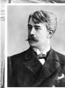
К. С. Станиславский, 1906 г.

В театральном мире наступил Год Константина Станиславского