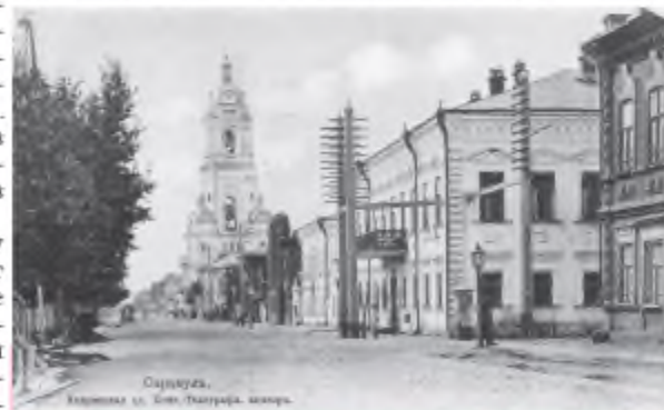
Сарапурская почтово-телеграфная контора. Начало XX века

По материалам Центрального музея связи им. А. С. Попова (г. Санкт-Петербург), Музея истории и культуры Среднего Прикамья, Управления по делам архивов Администрации г. Сарапур и Сарапурского МЦТЭТ - филиала ОАО «Ростелеком» в УР.