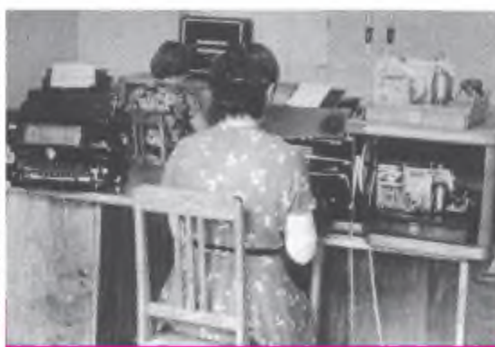
Рабочее место телеграфистки, 1962 год

Но и платили им очень хорошо: заработная плата составляла от 141 до 705 рублей, в то время как хлеб стоил от 2 до 6 копеек за буханку, 1 литр молока – 10 копеек, мешок картофеля –