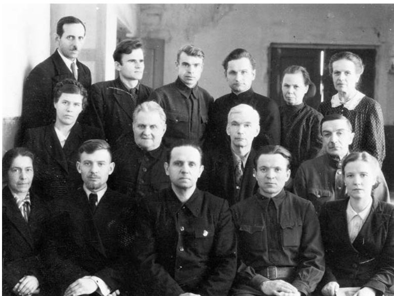
Коллектив преподавателей (год неизвестен)