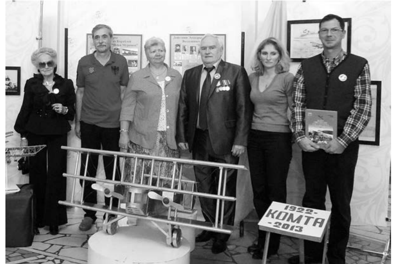
Потомки летчиков ДВК «Илья Муромец»

Вечером в ДК «Заря» состоялась презентация книги «Дивизион воздушных кораблей «Илья Муромец» в Сарапуле».