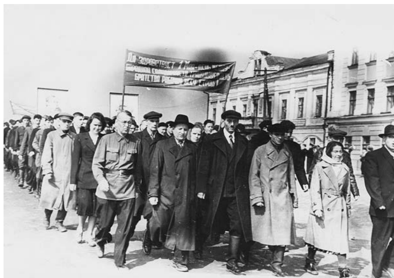
На Первомайской демонстрации