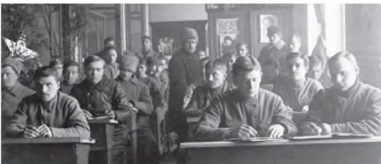
Слушатели курсов по тяжелой авиации, Сарапур, декабрь 1919 года