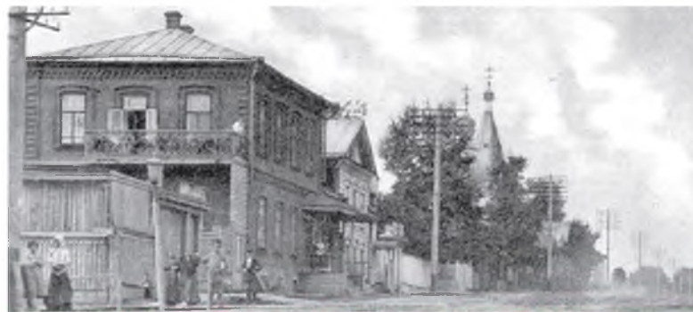
Публичная земская библиотека. Начало XX века

Подписчиками библиотеки ежегодно становились от 250 до 300 человек, а учителя уездных начальных училищ и члены земской Управы пользовались книжным фондом бесплатно. Для свободного посещения читателями библиотека была открыта четыре раза в неделю. В библиотеке была открыта специальная «читальная комната», в которой можно было бесплатно почитать книги, журналы или газеты, ее посещали до 2000 человек в год. В 1890 году в фонде библиотеки было 9030 экземпляров (3952 названия) книг и периодических изданий, были произведены практически всех классиков: от Пушкина, Лермонтова, Толстого, Гоголя, Тургенева, Достоевского и Чехова.