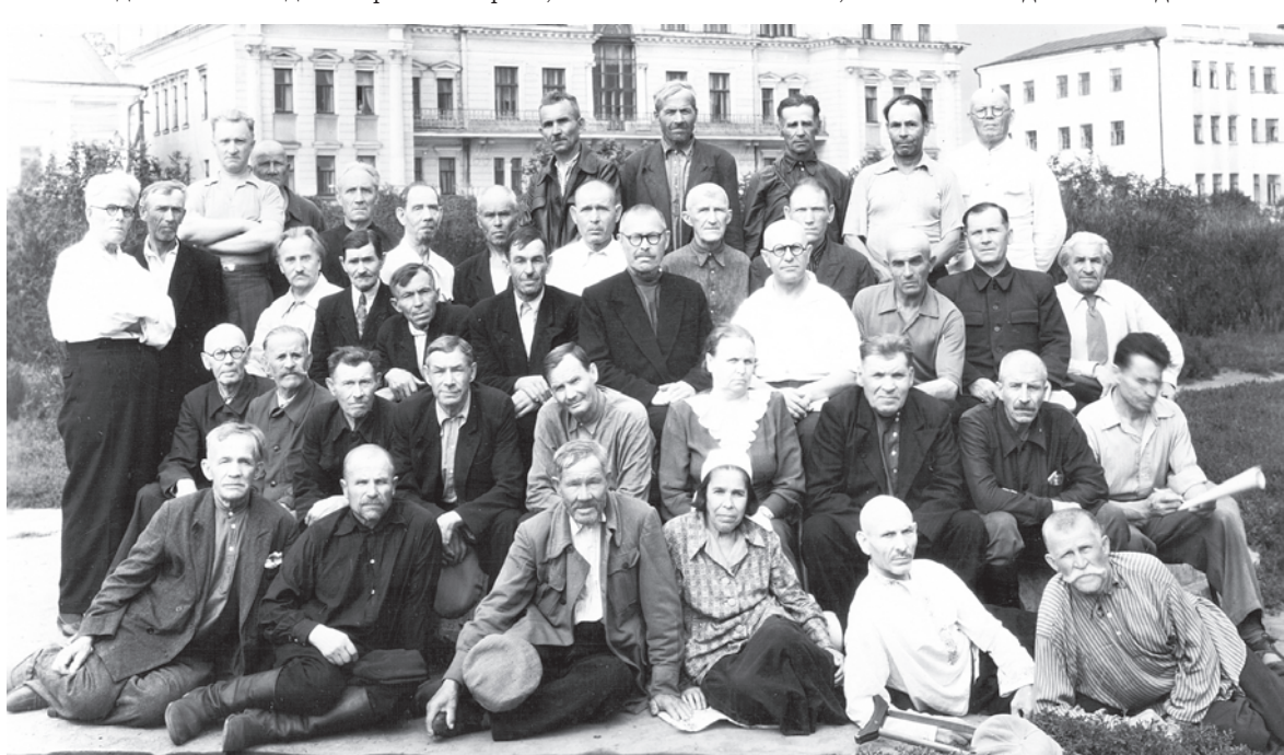
Ветераны Октябрьской революции и гражданской войны в г. Сарапуле. 1930-е годы

По материалам доклада в рамках конференции «Юные о великих» Музея истории и культуры Среднего Прикамья.