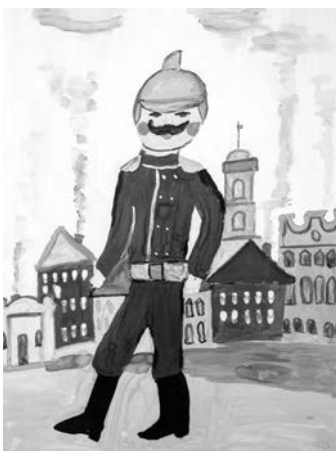
Рисунок Артура Имангаязова, 9 лет.