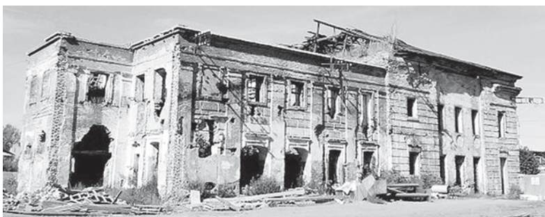
Покровский собор до 2012 года

том, что они вместо сгоревшей деревянной церкви имеют построить каменную и все к ней принадлежащее до священнодействия исправить своим коштом непременно, чего для и будут просить его преосвященство в сем предпрятии особым доношением. В чем и подписуются».