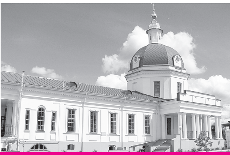
Покровский кафедральный собор после восстановления

На сей раз церкви повезло больше: видимо, учитывая опыт двух предыдущих пожаров, были приняты дополнительные меры к защите церковного имущества.