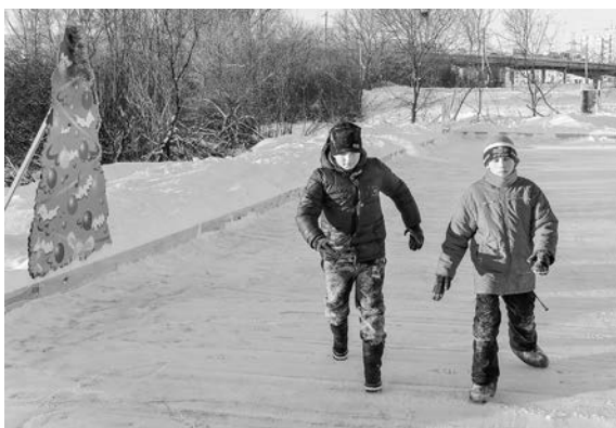
Каток у магазина «Фейрверк красок»

Не пустует каток и около магазина «Фейрверк красок». Лед залит и почищен. Настроение созда-