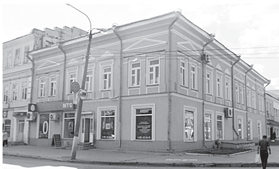
Дом по ул. Раскольников и Советской

В 1898 году его наградили памятной серебряной медалью «В бозе почив-