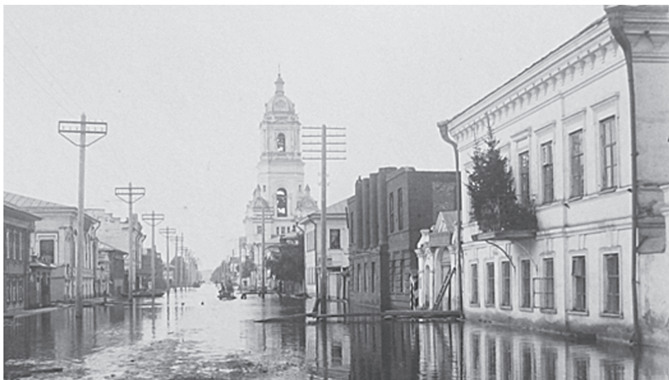
Дом по ул. Труда (белое здание справа)