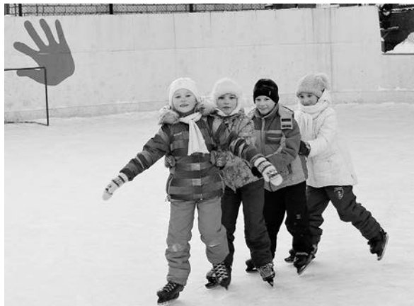
Каток школы-интерната для слабослышащих

ют елка, красочные фигуры из картона, горки, установленные рядом с катком. Несмотря на холодную погоду, по вечерам сюда приходит много детей.