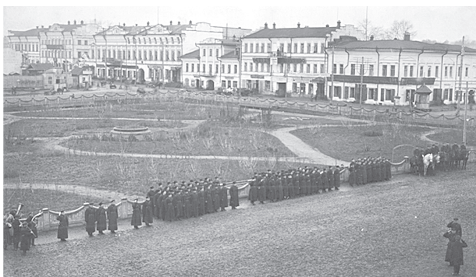
Красная площадь, 20-е годы XX века