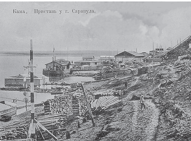
Кама. Пристань у г. Сарапула.

ным устройством общественного хозяйства в городе, едва ли уместно.