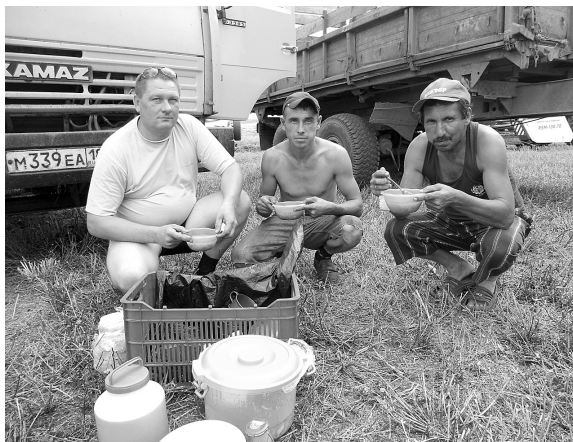
Чтобы не тратить драгоценное время, механизаторы ООО СХП «Мир» обедают прямо в поле