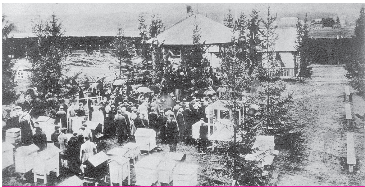
Первая сельскохозяйственно-кустарно-промышленная выставка. 1907 год