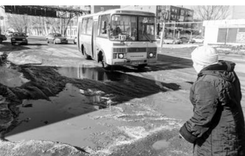
Остановка «Железнодорожный вокзал»

Впрочем, и во многих других точках города ситуация не лучше – хочется то ли на четвереньках передвигаться, то ли на мягкое место сесть и катиться с тротуаров-горочек.