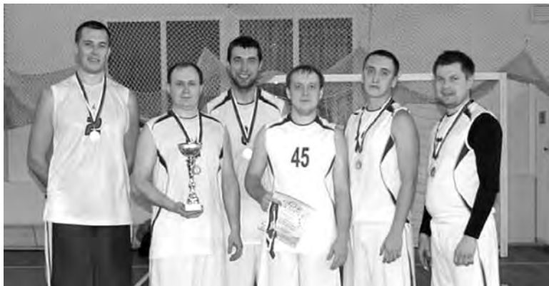
Команда с. Сигаево