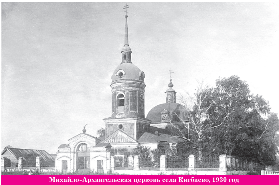
Михайло-Архангельская церковь села Кигбаево, 1930 год