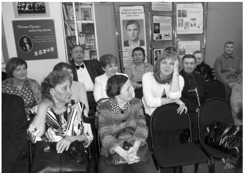
На Дне поэзии в Центральной библиотеке им. Н. К. Крупской

Под таким названием проходит серия творческих встреч Русской секции при Союзе писателей Удмуртии с самостоятельными авторами республики