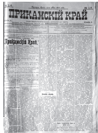
Первый номер газеты «Прикамский край», г. Сарапул, 17.05.1906 г.

Голодовка будет продолжаться до тех пор, пока гнусное начальство не извинится перед готовыми шайками, не объявит общему тайному избирательному праву, не исключая пола и возраста. Таковы наши требования. Ты не забудь прислать мне денег, если только ты прогрессивного на-