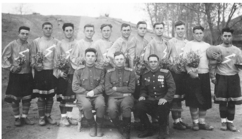
На спортивном поле команда «Электрик», 1946-1947 гг.

тая на радиозаводе, он играл в сборной по волейболу, а с 1958 года был в составе команды по забытому сейчас виду спорта - хоккею с мячом, так называемо-