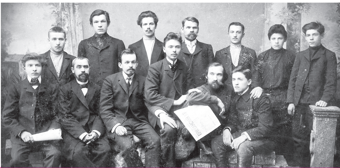
Сотрудники редакции газеты «Прикамский край», г. Сарапул, 1907 г.