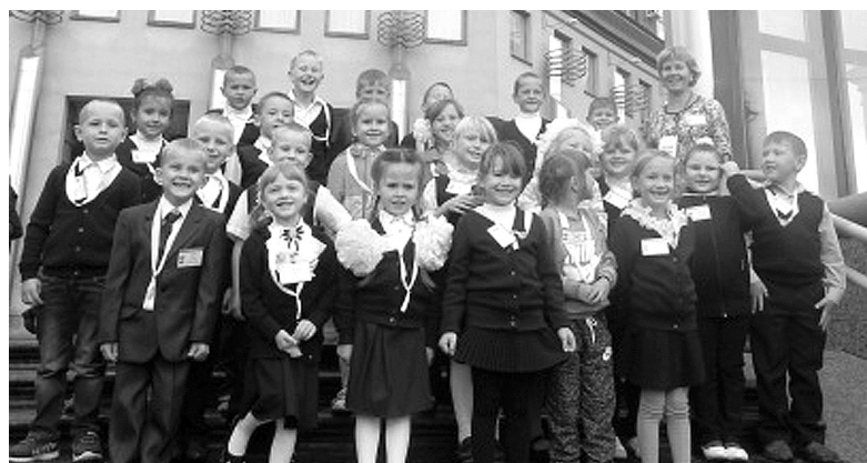
1 класс Кигбаевской школы в цирке

Стало уже доброй многолетней традицией в первые дни учебного года приглашать всех первоклассников Удмуртии на цирковые представления