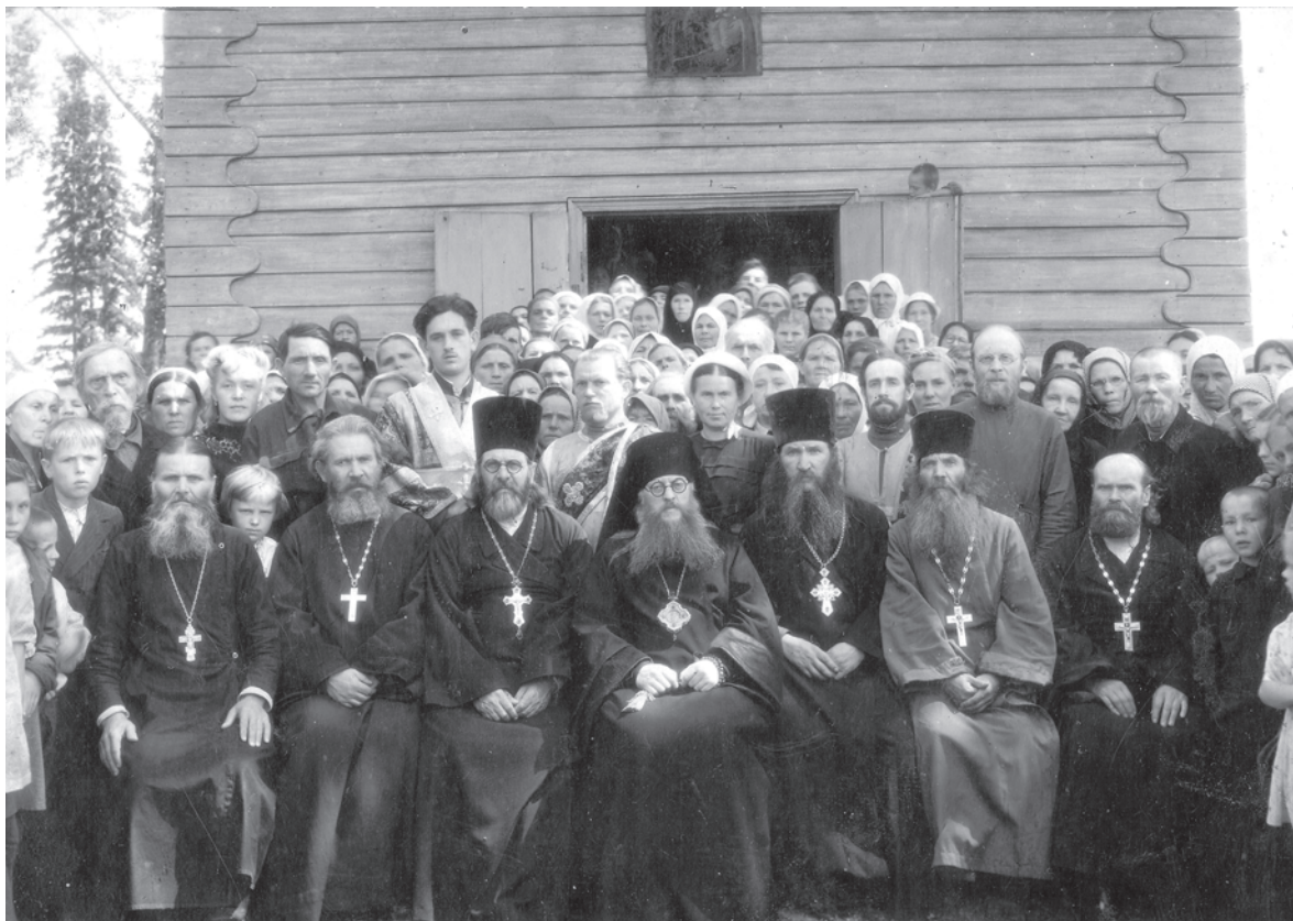
Георгиевская церковь: священники и паства