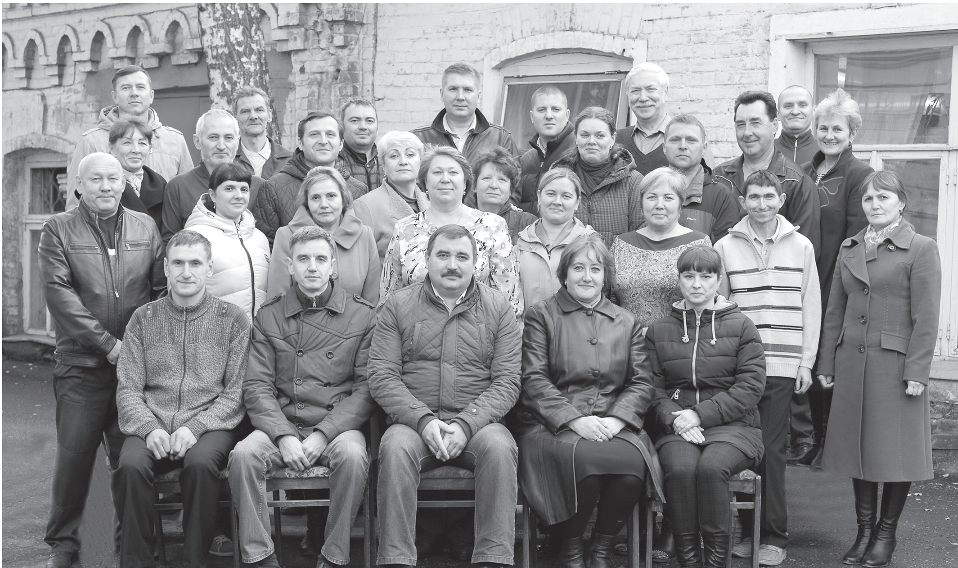
Коллектив Сарапульской типографии

В этом году Сарапульская типография отмечает 150-летие со дня основания