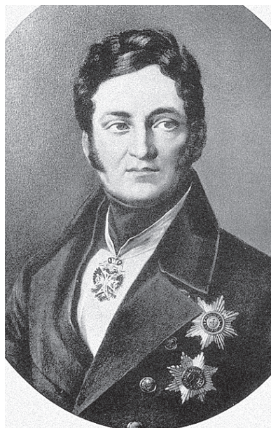
Лев Алексеевич Перовский

Граф Лев Алексеевич Перовский - один из братьев Перовских, к которому особенно благоволил император Николай I. В 1841- 1852 годах - министр внутренних дел, в 1852-1855 годах - министр уделов. Побочный сын графа Алексея Кирилловича Разумовского от мещанки Марии Михайловны Соболевской. Считался воспитанником графа, получил свою фамилию от имени Разумовского под Москвой - Перова, а имя - в честь дяди Льва Кирилловича.