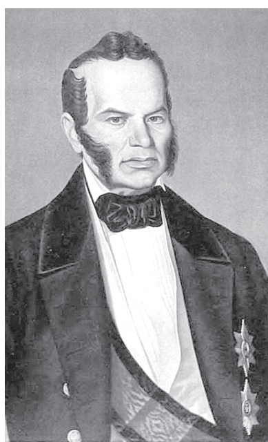
Федор Павлович Вронченко

Граф Федор Павлович Вронченко - государственный деятель Российской империи. С 19 апреля 1842 года - действительный тайный советник, с 1 мая 1844 года - статс-секретарь Его Императорского Величества Николая I, с 1 мая 1844 года по 6 апреля 1852 года - министр финансов России. Именем Вронченко назван корабль Балтийского военноморского флота Российской империи «Граф Вронченко».