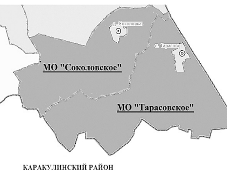
Схема многомандатных избирательных округов для проведения выборов депутатов Совета депутатов муниципального образования «Тарасовское» Сарапульского района

Приложение №2 к Постановлению Территориальной избирательной комиссии Сарапульского района № 6.2. от 29 июня 2016 года