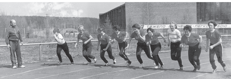
Старт участников соревнований по легкой атлетике