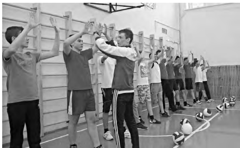
Номинация «Педагог здоровья»