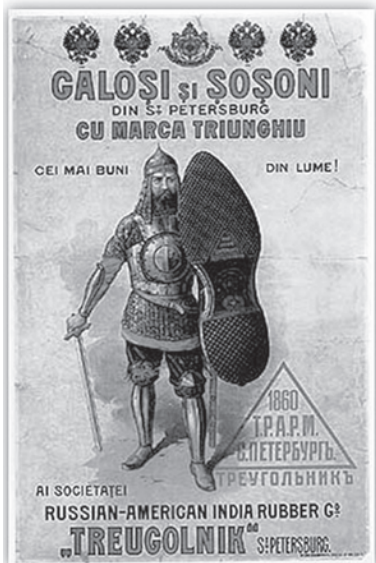
Российско-американская резиновая мануфактура