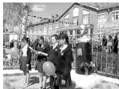
Акция «70 памятных мест Победы»