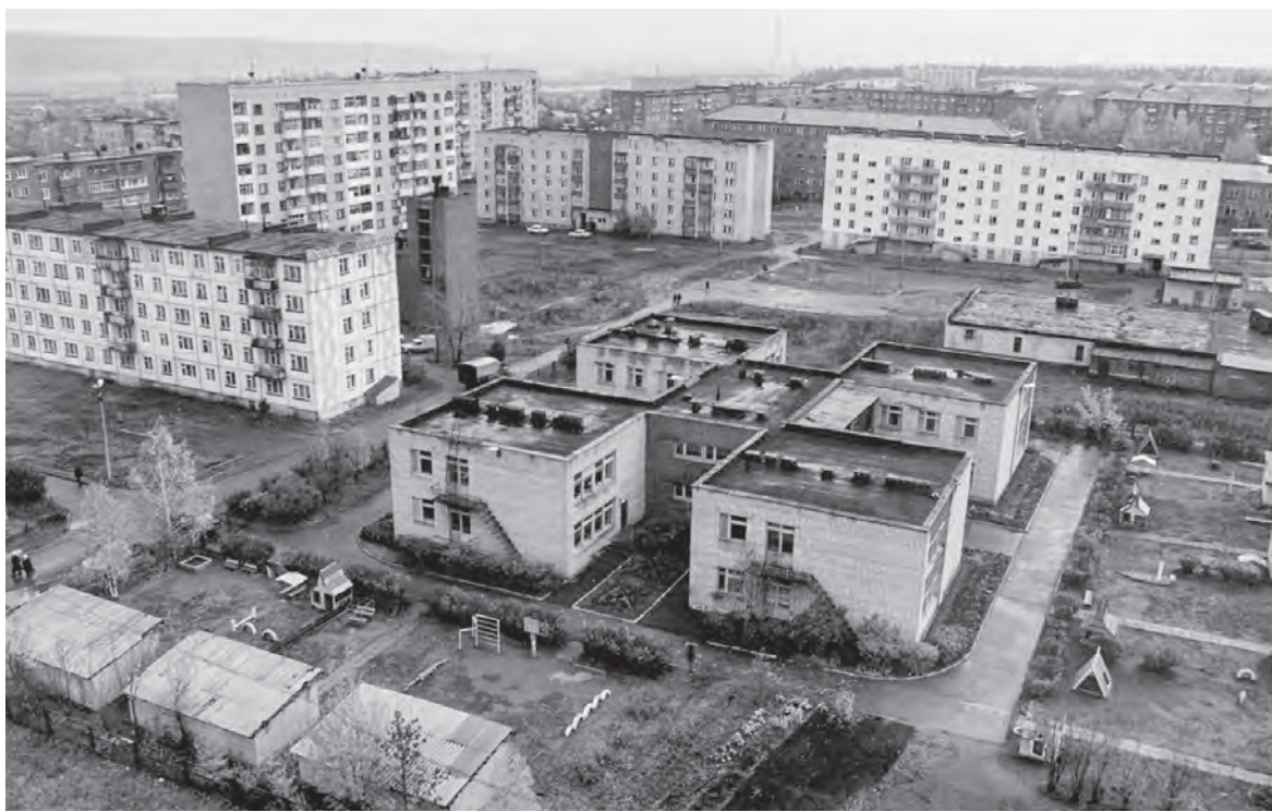
Панорама микрорайона «Элеконд» (1986 год)