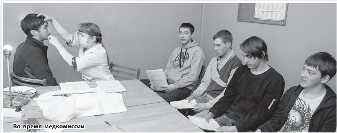
Во время медкомиссии

С начала апреля в нашем городе, как и в стране, стартовала весенняя призывная кампания