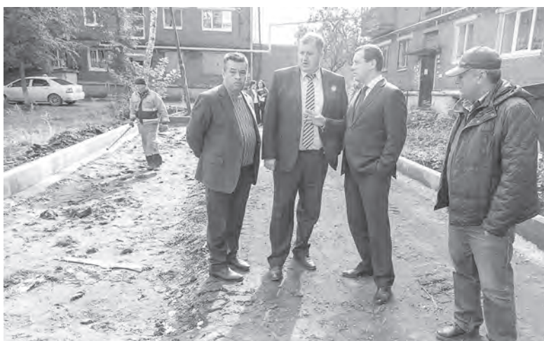
Благоустроительные работы ведутся на ул. Лескова, 23