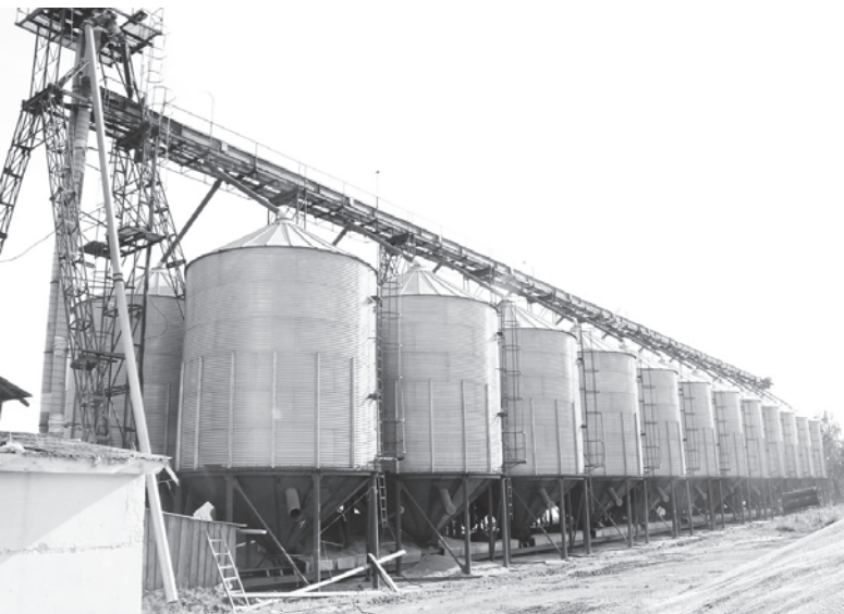
Так выглядят закрома Родины: 24 бункера для хранения (каждый объемом 100 тонн) заполнены зерном