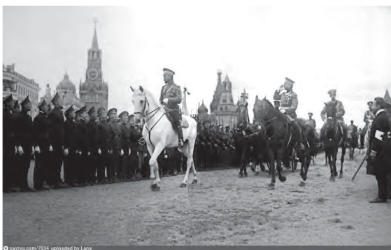
Император Николай II проводит смотр в Кремле по случаю 100-летия войны 1812 года. Август 1912 года

пульского реального училища Борисом Яковлевым: