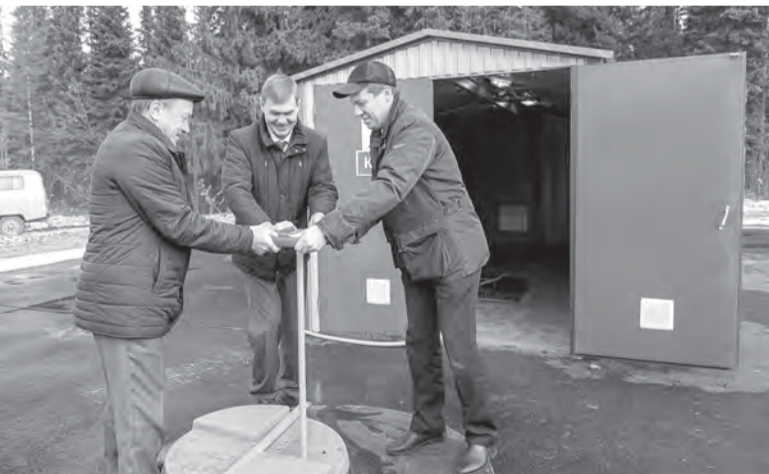
Торжественный запуск КНС произвели директор ООО «Газ-Сервис» Шамиль Акмалетдинов, и. о. министра энергетики, жилищно-коммунального хозяйства и государственного регулирования тарифов УР Иван Маринин и Глава города Александр Ессен

Новое здание, благоустроенная территория, аккуратный забор вокруг – так выглядит новая канализационно-насосная станция в пос. Строительный