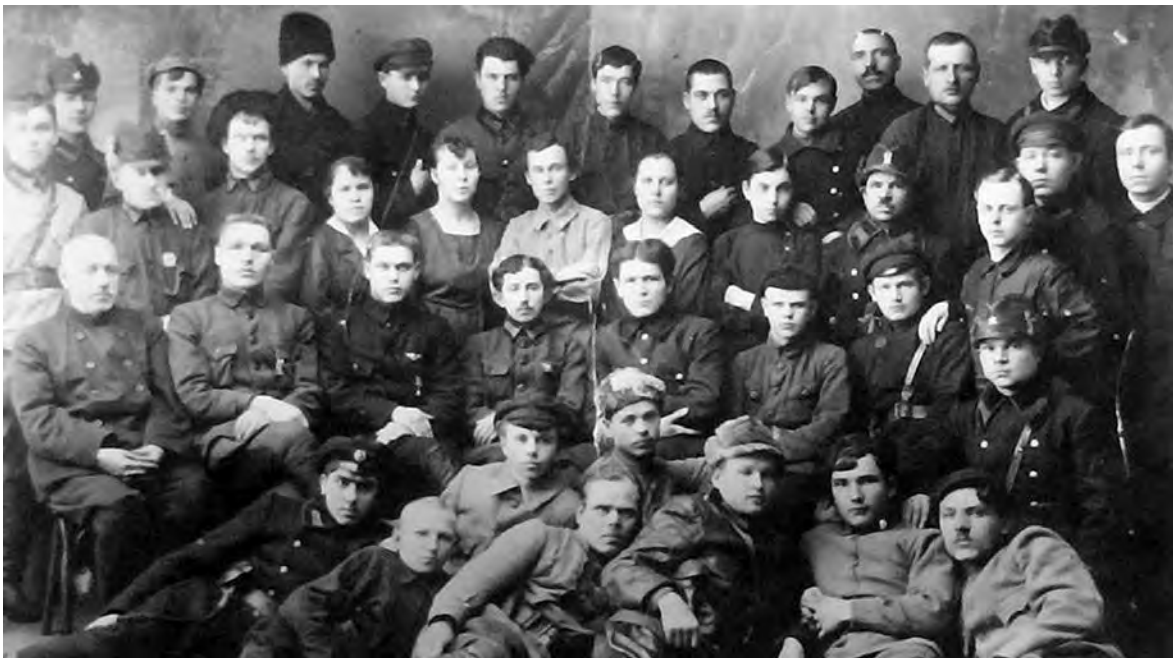
Сотрудники сарапульской милиции. 20-е годы прошлого века

В первых числах марта 1917 года в Сарапуле после получения сообщения о государственном перевороте был образован комитет общественной безопасности при уездной земской Управе