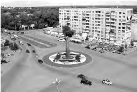
Площадь 200-летия Сарапула