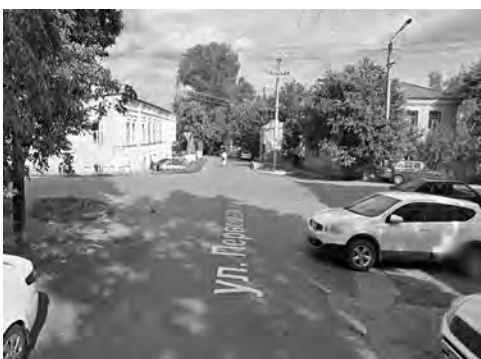
Ул. Первомайская от ул. Труда до ул. Некрасова