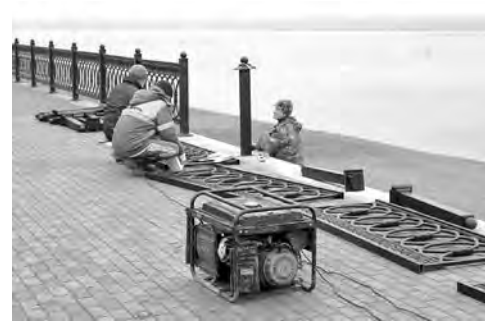
Набережная реки Камы от ул. Первомайской до лодочной станции