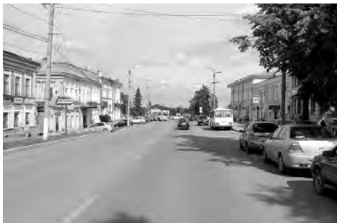
Ул. Советская от ул. Раскольниково до ул. Лесной