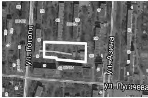
Территория в квартале между улицами Пугачева - Гоголя - Интернациональной - Азина

щественных пространств, которые предложены для голосования, перешли в список с прошлого года. В 2017 году они уже включались в число объектов, по которым проводилось голосование, набрали определенное число голосов, то есть получили поддержку жителей города, но заняли второе и последующие места, то есть не были включены в программу благоустройства. Сейчас они вновь представлены на голосование, чтобы определить очередность их благоустройства.