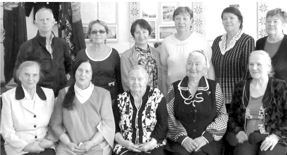
Ветераны педагогического труда Уральской школы

В 2018 году исполняется 80 лет со дня открытия школы в с. Уральский