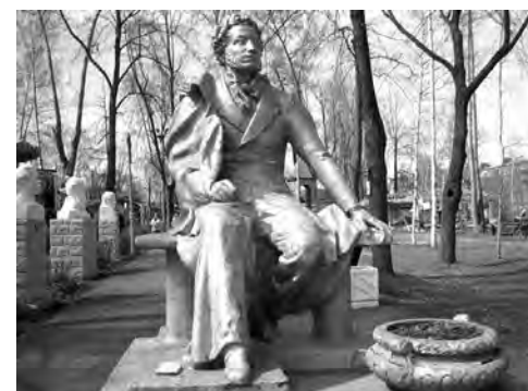
Городской сад им. А. С. Пушкина