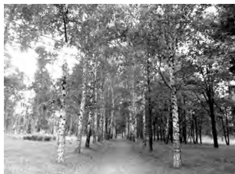
Парк им. В. И. Ленина