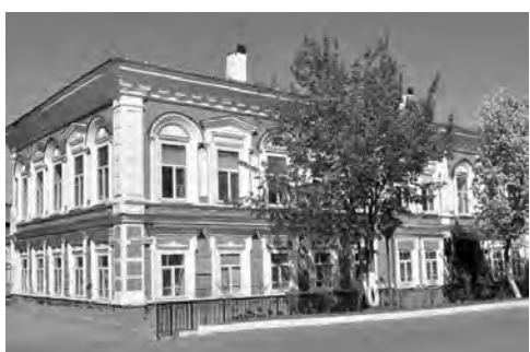
Ул. Красноармейская от ул. Советской до ул. Гагарина