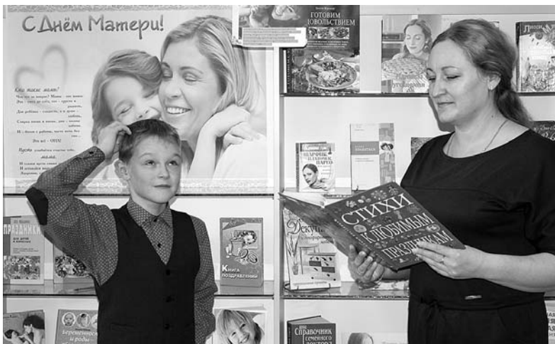
Фотография, победившая в конкурсе

Под таким названием прошел фотоконкурс, организованный районной библиотекой с. Сигаево