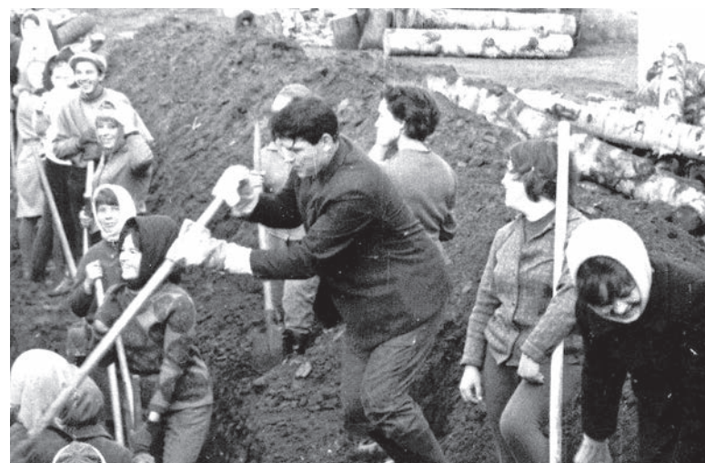
Субботник на строительстве Дворца культуры радиозавода