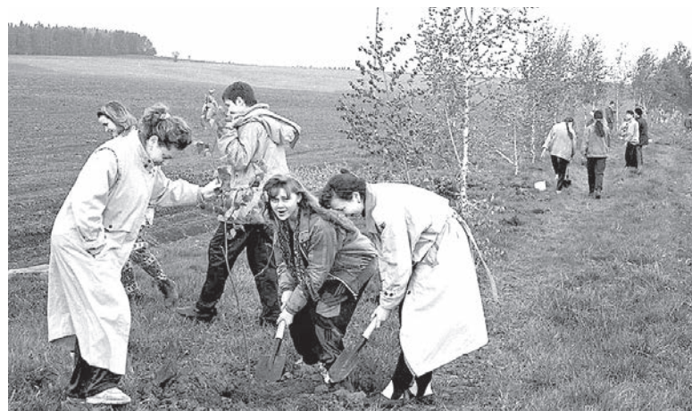
Посадка деревьев на Аллее Славы по Ижевскому тракту