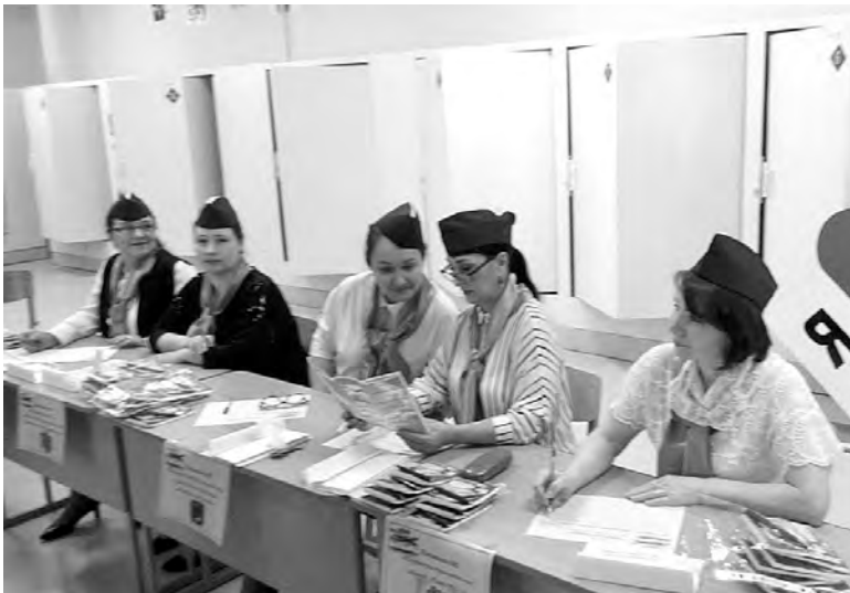
В ходе образовательного события в школе № 13

Детско-юношеский центр представил гостям и участникам ярмарки опыт работы с социально ориентированными некоммерческими организациями. Были презентованы основные направления деятельности Центра, а также доклад «Гранты – один из эффективных механизмов финансирования деятельности учреждения дополнительного образования». Педагоги представили опыт сетевого взаимодействия и практики наставничества как залог успешной деятельности ТСК «НИКА», а затем гости познакомились с деятельностью детского общественного движения «Юность» в Сарапуле в разрезе личностных достижений участников и их самореализации. Для гостей Детско-юношеского центра была организована экскурсия по учреждению и выставка-про-