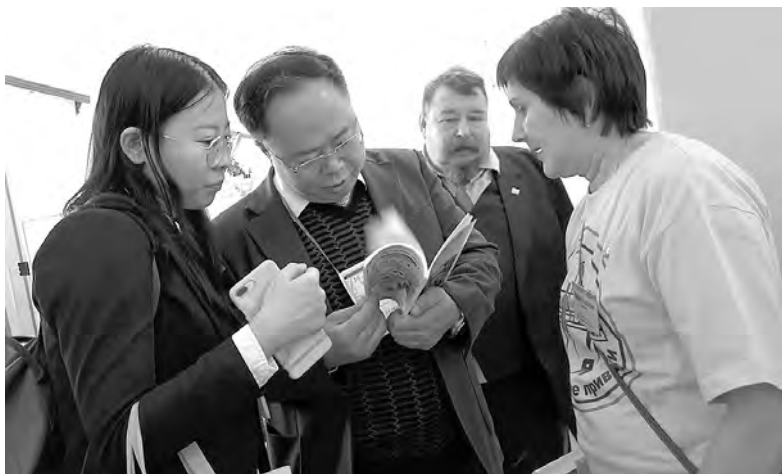
Участники ярмарки из г. Харбина КНР во время стендовых презентаций в школе № 15

В ходе работы XVI Международной ярмарки социально-педагогических инноваций наш город в очередной раз доказал, что является территорией опережающего развития