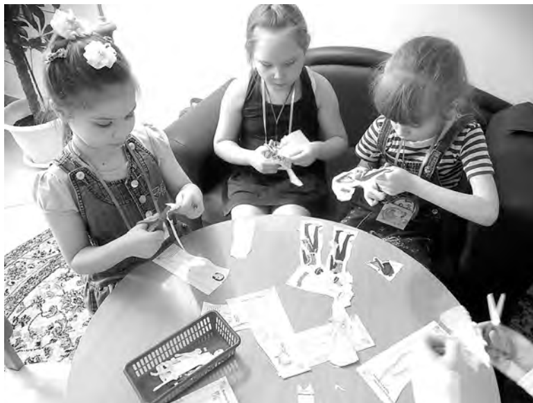
Дети занимаются в одном из «центров активности» детского сада № 8

Воспитанники и педагоги детского сада № 20 встретили гостей музыкальным приветствием, затем им была представлена визитная карточка о деятельности детского сада с момента его открытия, об успехах и достижениях, которых до-