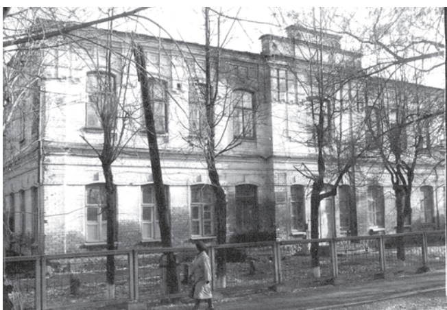
Ремесленная школа (район Поворота, позднее здесь располагалась детская больница, ныне проводится реконструкция здания)