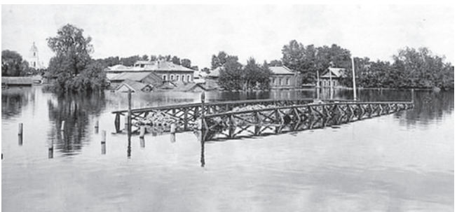
Весеннее половодье на р. Сарапулке – мост практически ушел под воду (фото первого десятилетия XX века)

В 1913 году был построен мост через речку Сарапулку по ул. Вятской (ныне – ул. Раскольников). Мост получил название «Романовский» в честь отмечаемого в тот год 300-летия царской династии Романовых. Название это сохранилось и по сей день.