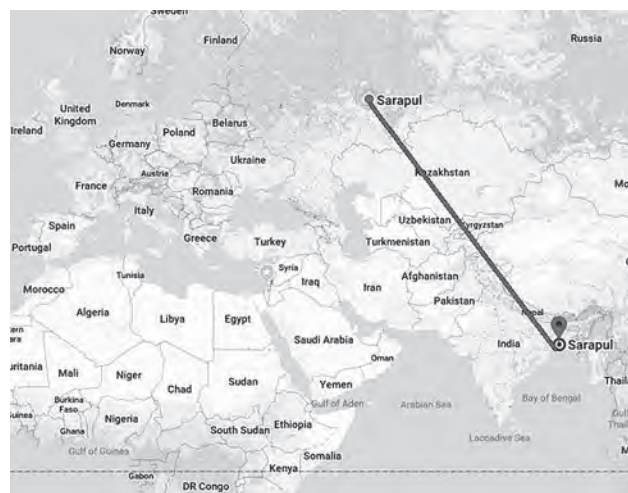
Два Сарапур на карте, 4695 км между нами

Почему астероид 26851 назван именем нашего города?