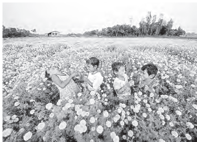
Поле бархатцев, Сарапур, Индия

В деревне живут мусульмане и индусы, все говорят на бенгальском языке. Они живут дружно, без религиозных неприязней. Деревня Сарапур упоминается в индийской литературе, например, в книге «Ганга» (1957 год, автор Самареш Басу). В повести рассказывается о рыбаках из Сара-