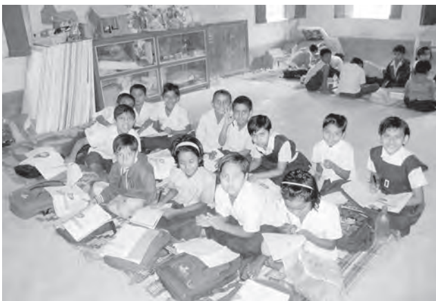
Сарапурские школьники, Индия

Открытие Сарапур в Индии помогло мне узнать что-то новое и о нашем родном городе.