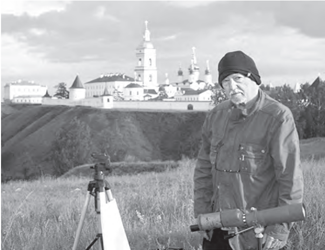
Эрик Элст, бельгийский астроном, назвавший астероид 26851 Сарапуром

Небесный Сарапур, Сарапур № 2, - это астероид. Прямо сейчас он находится в небе над нами. Он останется там до конца апреля. Этот астероид был открыт 30 июля 1992 года бельгийским астрономом Эриком Элстом в Чилийской обсерватории «La Silla». После открытия нового астероида за ним наблюдают около 10 лет, только после этого дают имя. 1 июня 2007 года Эрик Элст предложил имя Сарапур Центру Малых Планет Гарвардского университета США. Этот астероид обращается вокруг Солнца за 4,5 года. В первый раз он был увиден как неизвестное космическое тело 23 августа 1974 года. Диаметр астероида Сарапур - 6,048 км. Он описывается как «небольшой, но очень яркий астероид». Официальная страница NASA приводит такой комментарий нашему тезке-астероиду: «Сарапур - русский город на реке Кама, был основан в XVI веке и служил торговым центром на пути в Сибирь».