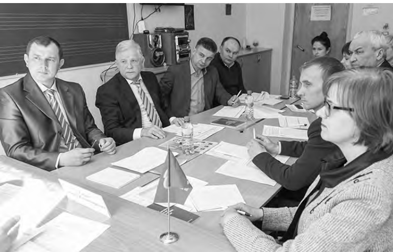
Заседание секции «Городская среда»

Во-первых, необходимо максимальное внимание уделить первичному звену, которое является у нас самым «больным» в здравоохранении. В рамках решения проблемы «кадрового голода» мы внесли предложение, во-первых, распространить программу «Земский доктор» на моногорода, а во-вторых, включить в эту программу на селе средний медицинский персонал. Как вариант – рассмотреть стро-