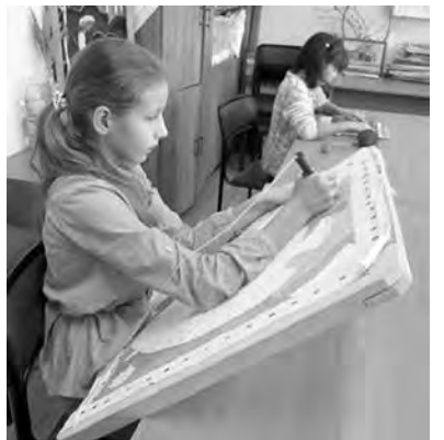
Занятие в объединении «Фантазия»