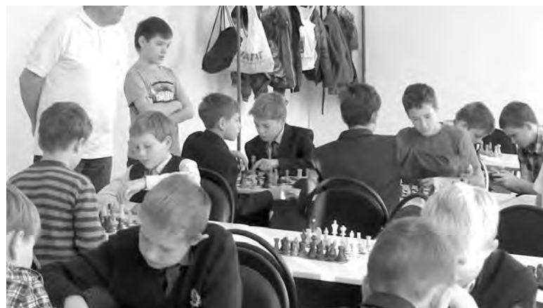
Детское общественное движение «Юность». Шахматный турнир