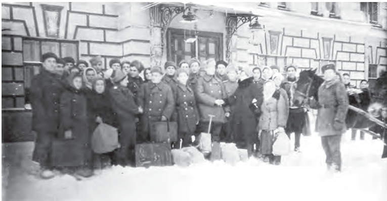
Эвакогоспиталь № 3892, в годы Великой Отечественной войны располагавшийся в Доме Советов (Красная площадь, 8)

— Это не сарапульцы, а «икуированные», которые не понимают, что такое сапожник. «Выковыренные», — уточняет она в отместку за надругательство над уважаемым ремеслом.