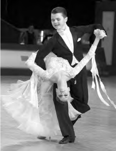
Танцевально-спортивный клуб «Ника»

В Детско-юношеском центре детям помогают развить наклонности, данные природой, обрести интерес к творчеству, познанию себя и открытию в себе по-