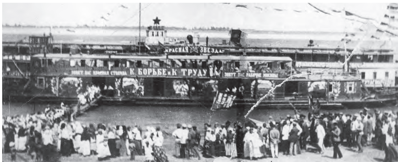
Митинг жителей г. Сарапула на набережной реки Кама, организованный для встречи агитационно-инструкторского парохода ВЦИК «Красная звезда»

В Сарапул прибыл агитационно-инструкторский пароход «Красная звезда», на котором выезжала специальная группа инструкторов ЦК РКП(б) и ВЦИК для проведения агитационно-пропагандистской и культурно-просветительской работы среди войсковых частей и населения. В составе группы находилась Н.К. Крупская - член коллегии Наркомата просвещения РСФСР.