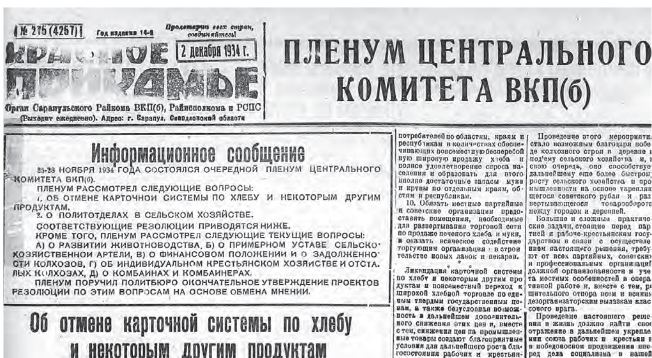
Первый номер газеты «Красное Прикамье», сохранившийся в архиве г. Сарапула

Вышел первый номер газеты «Красное Прикамье» - органа исполкома Сарапульского уездного Совета рабочих, крестьянских и красноармейских депутатов. В настоящее время - газета города Сарапула и Сарапульского района «Красное Прикамье».