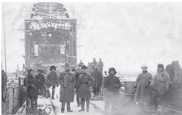
Железнодорожный мост через р. Каму

Построен железнодорожный мост через р. Каму у г. Сарапула.