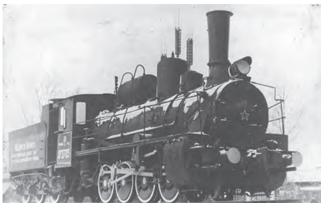
11 марта 1919 года эшелон с дарственным хлебом сарапульских крестьян прибыл в Москву

II съезд комитетов бедноты Сарапульского уезда Вятской губернии принял решение о сборе по всем деревням уезда 80 тысяч пудов зерна голодающим рабочим Москвы и Петрограда.